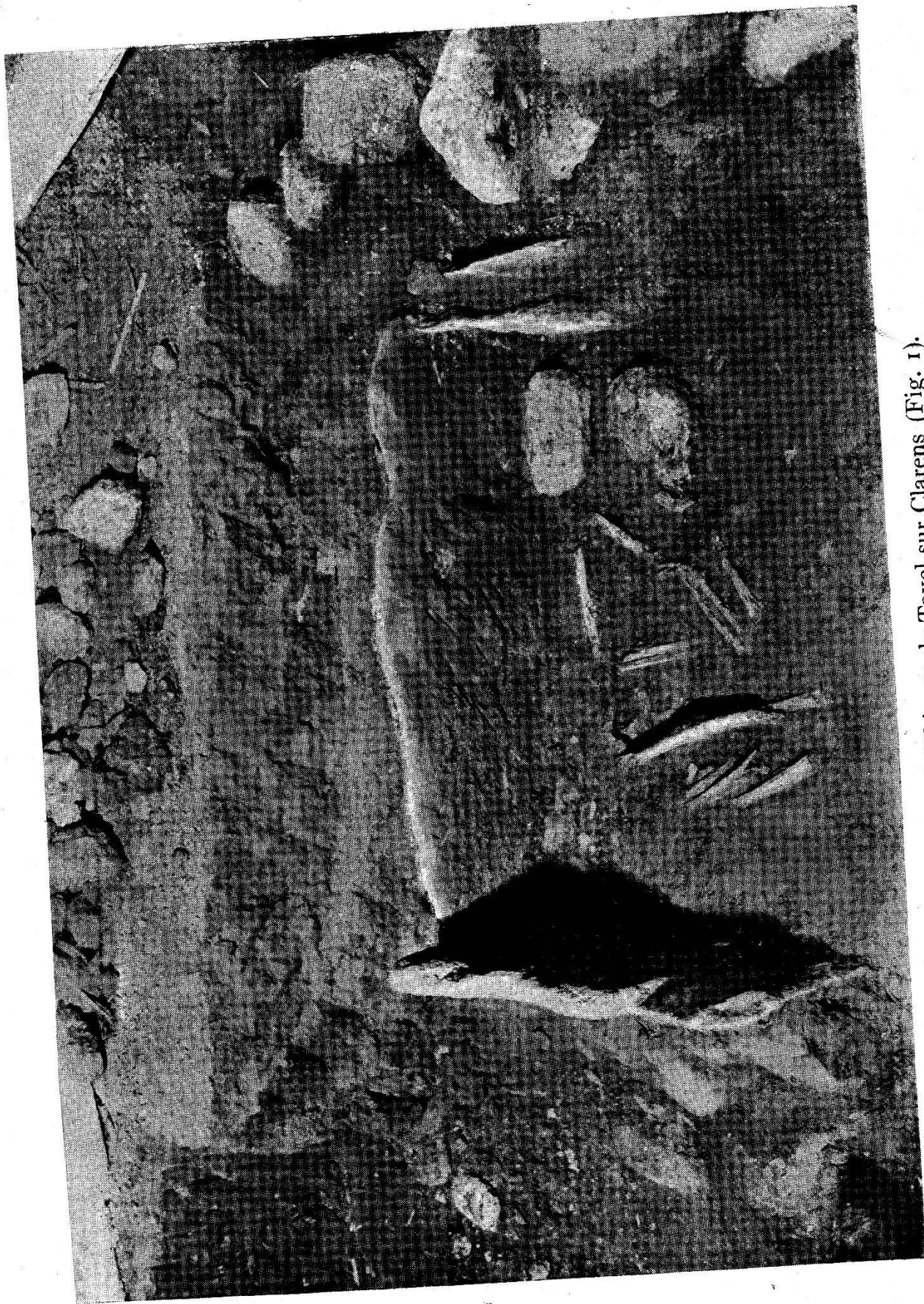
Les tombes néolithiques de Tavel sur Clarens (Fig. 1).