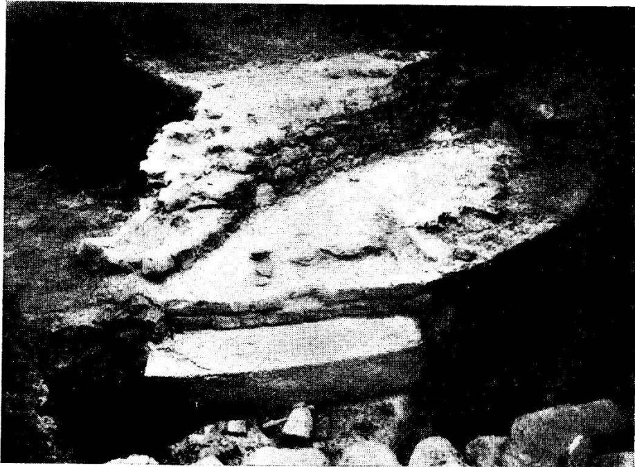
FIG. 8. — La tour d'angle Sud-Est découverte en 1906.

La tour de l'angle S.-E. de l'enceinte est découverte et apparaît rapidement et splendide sous la pioche des ouvriers.