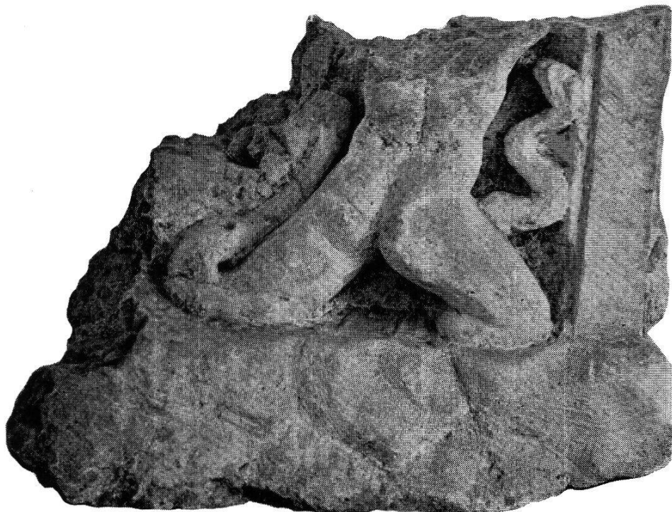
2. Géant anguipède