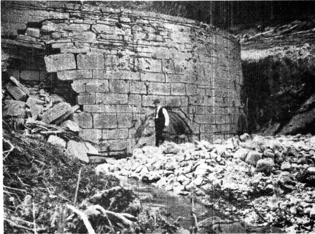
Barrage de la Joux-Verte.

la rivière. Au printemps, dès que le torrent s'enflait par les grosses pluies et la fonte des neiges, on fermait l'écluse et un lac se formait en amont. Dès que l'eau arasait le sommet du barrage, on lâchait un bélier qui ouvrait brusquement la porte et l'eau s'échappait avec violence, chassant au-devant d'elle le bois accumulé qui allait choir dans un bassin ménagé à Roche. Il se faisait deux ou trois flottages par année, et la quantité de bois amenée à Roche était d'environ mille cinq cents stères.