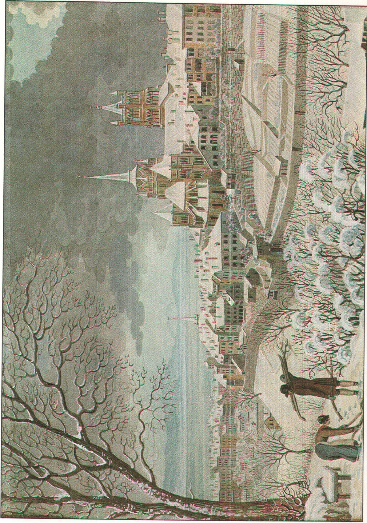
Lausanne sous la neige, vers 1830 Anonyme, MHAEL Coll. du Vieux-Lausanne