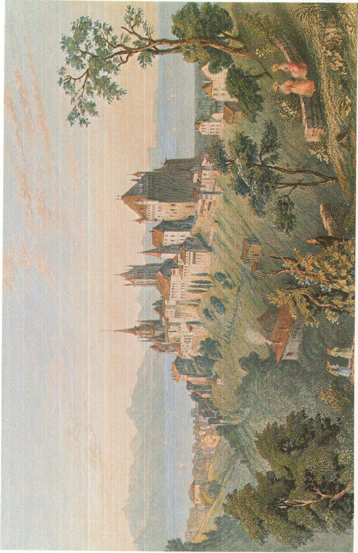
La Cité en 1834 W. H. Bartlett, MHAEL Coll. du Vieux-Lausanne, photo A. Held