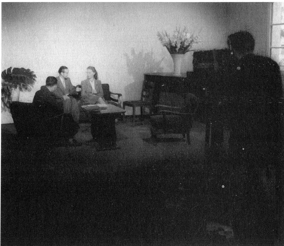
Essais et démonstrations de télévision à Lausanne, Comptoir suisse, Palais de Beaulieu, 1947