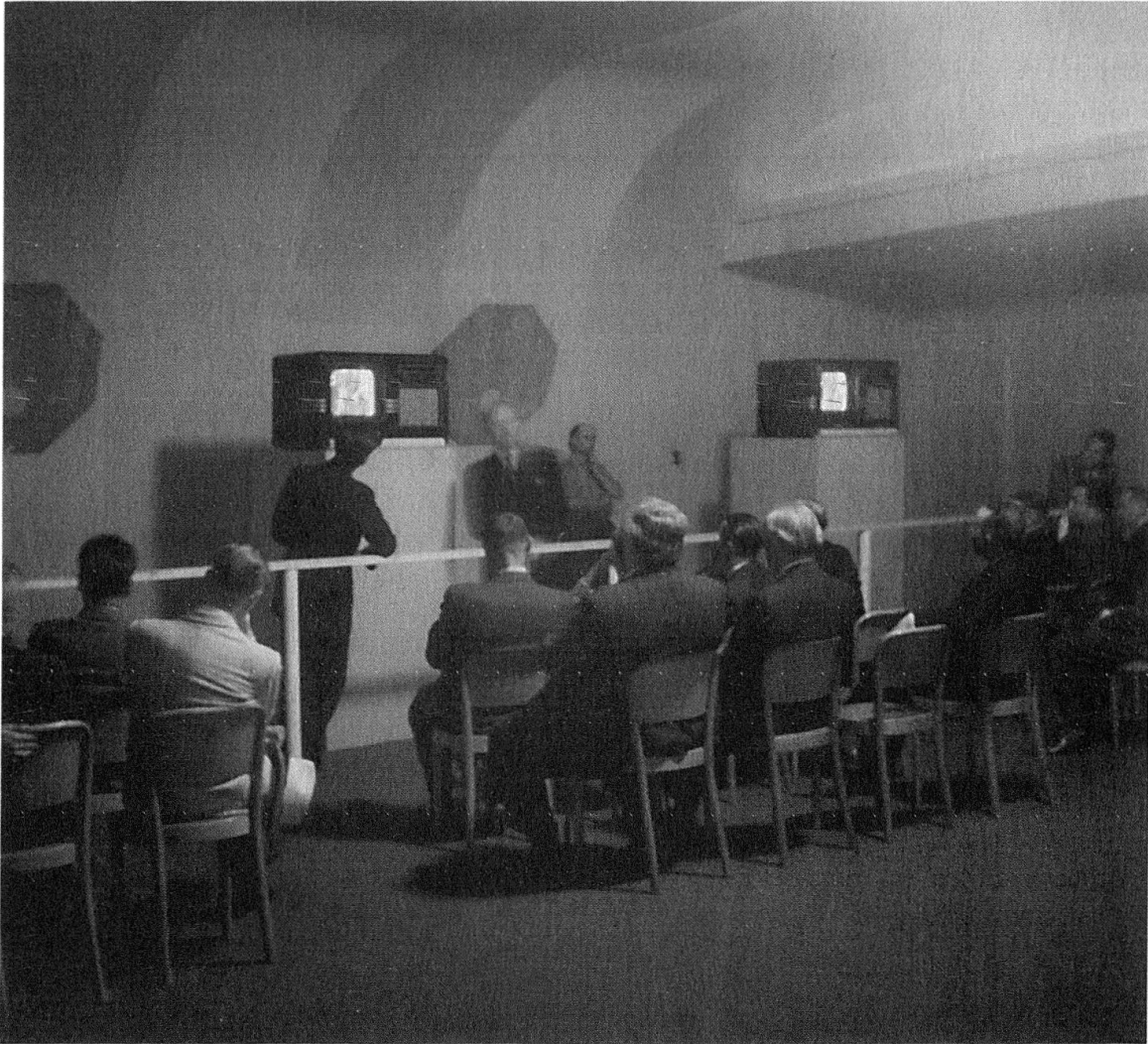
Essais et démonstrations de télévision à Lausanne, Comptoir suisse, Palais de Beaulieu, 1947