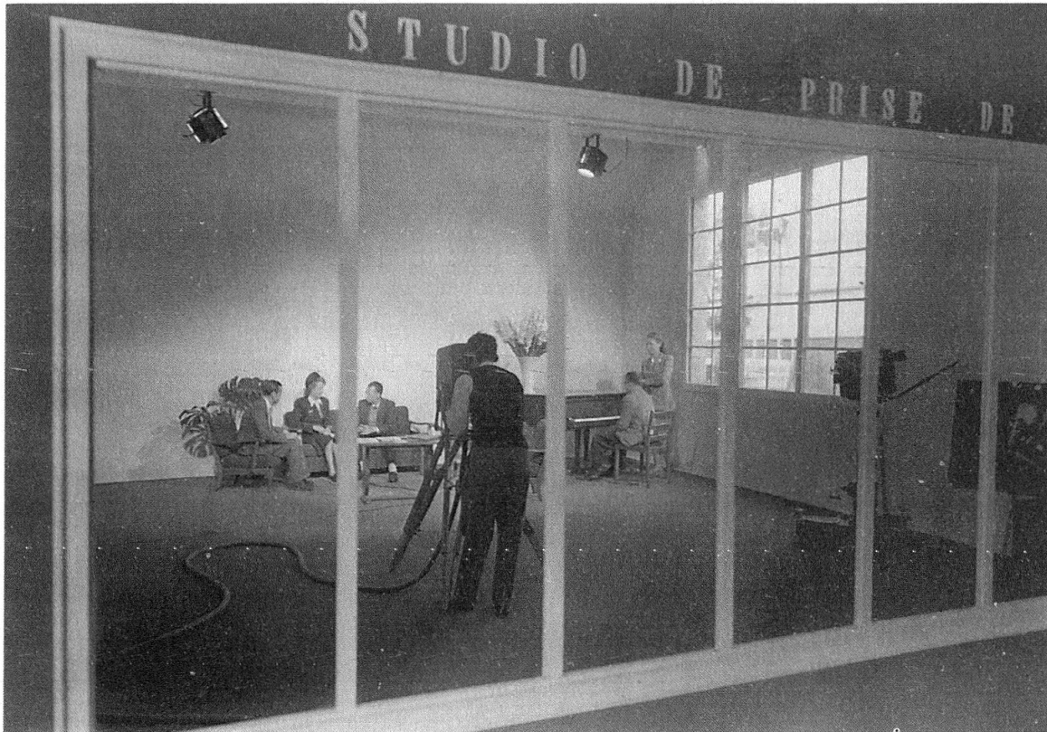
Essais et démonstrations de télévision à Lausanne, Comptoir suisse, Palais de Beaulieu, 1947

En janvier 1951, les premiers tests révèlent une mauvaise réception des ondes dues aux conditions géographiques particulières de la ville. Pour y remédier, le mât fabriqué par l'entreprise lausannoise Belet est rallongé jusqu'à trente-huit mètres 15 . Pesant quatre cents kilos, il se brise lors de l'installation sur le toit du bâtiment de la radio, début février. Les deux antennes (image et son) sont complètement détruites. Sur la base de plans envoyés par Philips, le professeur Julliard doit les reconstruire dans le plus bref délai. Le 17 février, l'installation est enfin terminée. Il ne reste alors plus qu'à régler les antennes de réception disséminées dans la ville et à terminer l'éclairage du studio.