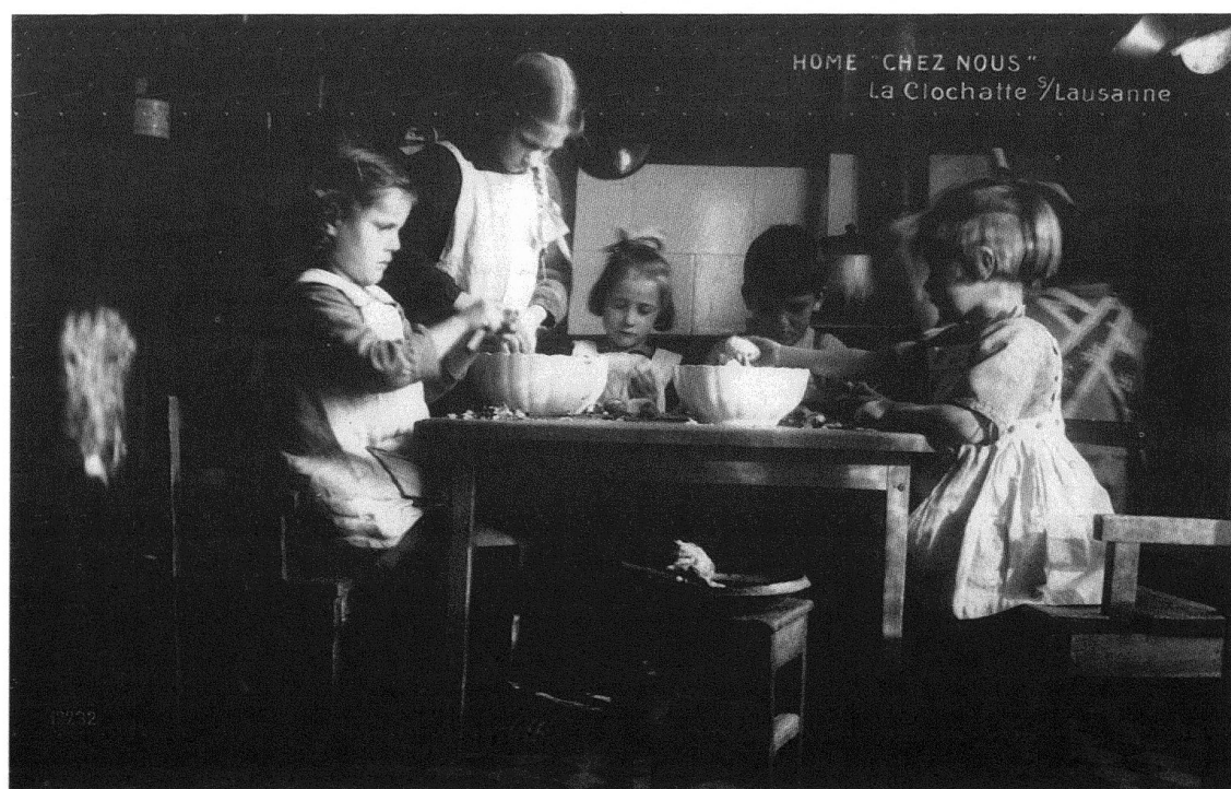
1-2 Cartes postales éditées par le Home « Chez Nous », montrant des enfants de l'institution qui se débrouillent sans adulte dans la vie quotidienne.