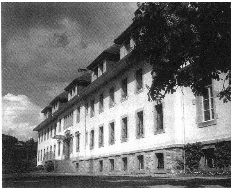
2 Entre prison et école. Bâtiment cellulaire construit en 1899-1900 sur le modèle carcéral au moment où l'École de réforme va remplacer la Discipline.

Archives du Centre d'orientation et de formation professionnelles COFOP.