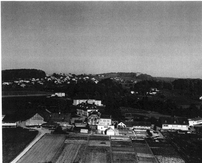
1 Le site de la Maison d'éducation de Vennes vers 1970 où l'on peut lire les étapes de l'institution: les anciens bâtiments de ferme de la Discipline des Croisettes (1846), le bâtiment cellulaire de l'École de réforme (1902) et les pavillons de la Maison d'éducation de Vennes (1967).