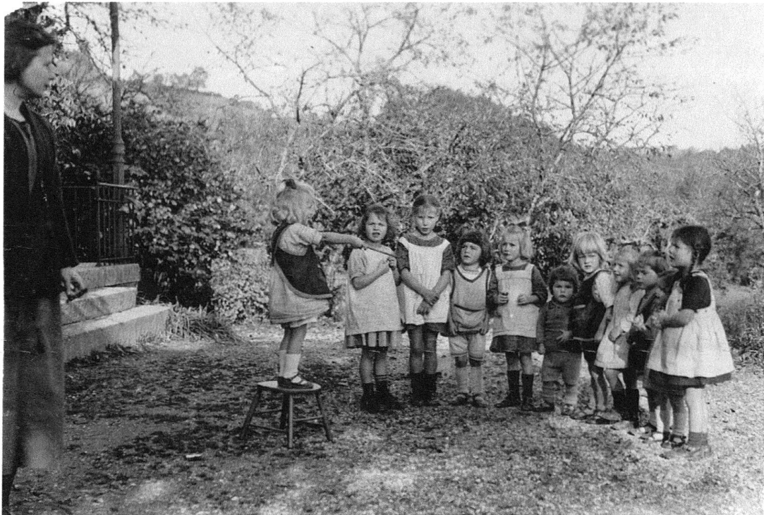
4-5 La même prise de vue comporte une différence importante selon qu'elle est destinée au public pour la page de couverture du Rapport sur l'activité durant 1924 (Archives Home « Chez Nous ».) ou à un usage privé dans l'album de photographies d'une ancienne élève. La vraie directrice de ce chœur d'enfants n'est probablement pas celle qui tient la baguette.