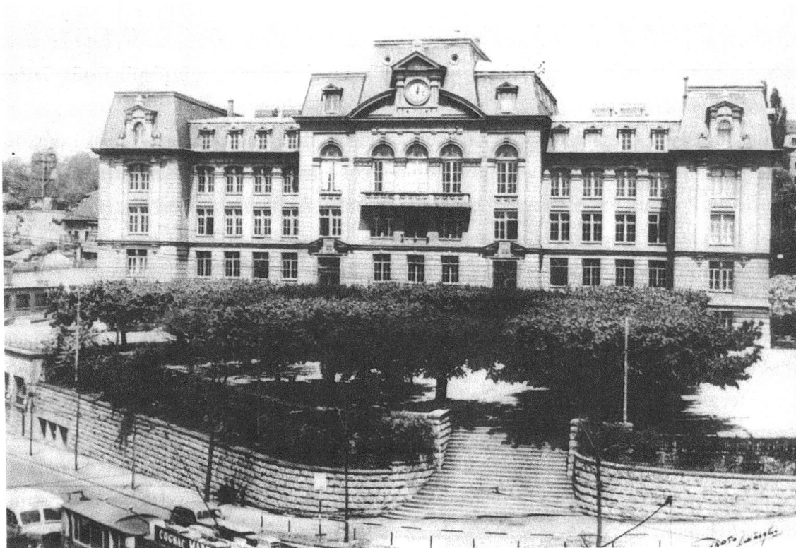
1. Le bâtiment de l'École normale vers 1940. ACV, K XIII 377/230/605, photographie de l'auteur.

Ce problème crucial désarçonne le Département de l'instruction publique; par le biais de mesures exceptionnelles et prises dans l'urgence, il doit alors fréquemment faire face à une situation qu'il peine à maîtriser. Au niveau de la formation des instituteurs et des institutrices, l'École normale de Lausanne (ÉNL) se voit contrainte d'adapter sa structure à la nouvelle situation avec grande difficulté. Le département décide alors de créer en 1953 une classe spéciale de formation rapide au sein de l'ÉNL, d'une durée d'un an, destinée aux porteurs d'un baccalauréat, d'un certificat de maturité ou d'un diplôme de culture générale. Dès 1967, cette filière se nomme «classes de formation pédagogique». En 1965, est créée l'ÉN d'Yverdon qui fait partie du Centre d'enseignement supérieur du Nord vaudois (CESSNOV); ce centre regroupe ainsi dès 1975 un gymnase, l'ancienne ÉN et une division commerciale. Deux ans plus tard, les classes de formation pédagogique sont dirigées désormais par le directeur-adjoint du Séminaire pédagogique de l'enseignement secondaire (SPES) fondé en 1959, accentuant le rapprochement entre les deux institutions, alors que peu après il est décidé aussi de former des enseignant·e·s primaires à Montreux.