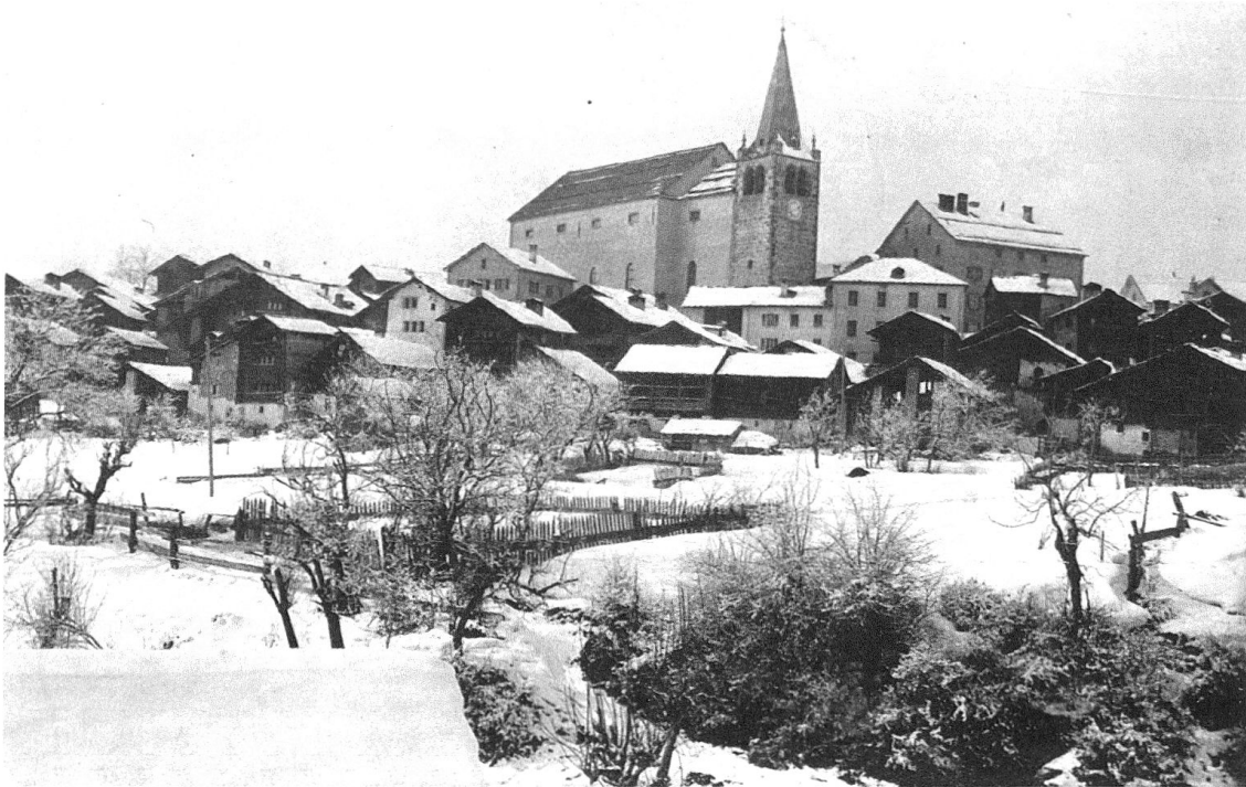
7 Village de Lens. Collection privée, photographie.

» Vais à 6 h- 1 / 4 la trouve vers la fontaine avec Christ. Je passe elle m'appelle: vous ne m'attendez pas! Montons ensemble: jamais je n'ai eu moins de bons amis elle a été se confesser général. Assis ensemble un instant sur l'escalier puis allons M[uret] et moi aux morilles [.]