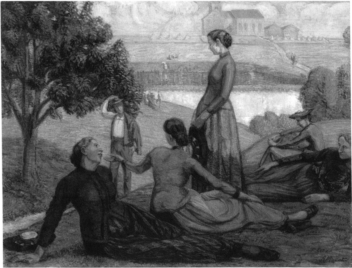
3 Albert Muret, Le Dimanche après-midi , vers 1908, huile sur toile, 150 cm x 195 cm. Musées cantonaux, H. Preisig, Sion.

devant elles en les saluant de son chapeau. Qui est-il? Un monsieur élégant au chapeau de ville avec une ceinture rouge qui pourrait être notre peintre? Au deuxième plan, un groupe de femmes et d'hommes discutent devant le lac de Lens: le Louché. Au troisième plan, des champs et plus loin les foins qui attendent la fenaison. L'Église de Lens clôt l'espace; aucune construction ne vient déranger la tranquillité du paysage post-impressionniste. Muret transpose la réalité du paysage qu'il voit quotidiennement depuis son chalet. Il donne à penser que l'Église est bien plus proche de sa maison qu'elle ne paraît aujourd'hui, car le village s'est bien agrandi depuis.