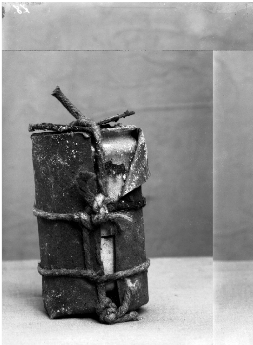
1 Engin trouvé devant la Banque cantonale vaudoise en 1906, cliché de R. A. Reiss, © IPS 9 .