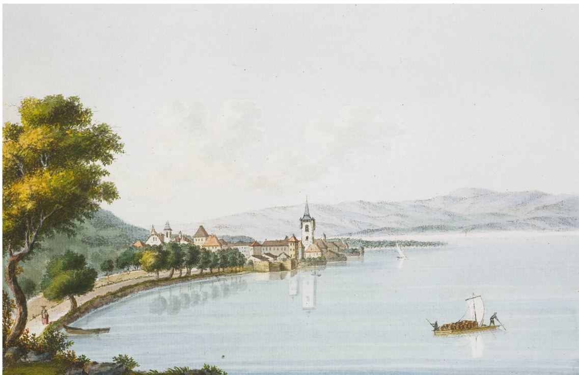
Fig. 3. Jean-François Albanis Beaumont, « [Vue d'Évian] », in Jean-François Albanis Beaumont, Voyage pittoresque aux Alpes pennines , Genève: Isaac Bardin, 1787. BGE.

littérature de voyage illustrée. Albanis Beaumont est l'un de ces artistes encore attachés à une vision classique du paysage, avec un goût marqué pour une nature évoquant un certain bien-être et où le beau et l'utile sont souvent associés. Dans ses dessins du lac, l'artiste porte une attention particulière aux rivages et à l'activité humaine qui s'y déroule; c'est un élément important de sa vision, qu'on retrouve par exemple dans la vue «Évian», publiée en 1787. Cette représentation de la petite ville, avec ses maisons bien ordonnées au bord de l'eau, évoque une certaine aisance tandis que la barque chargée de marchandises, avec ses deux bateliers en action, rappelle le caractère utile du lac.