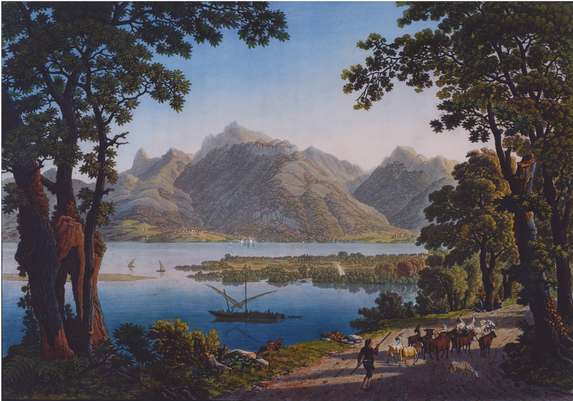
Fig. 4. Gabriel Lory père, «Vue de l'extrémité du Lac de Genève, et de l'entrée du Rhône près le Boveret», in Gabriel Lory, Voyage pittoresque de Genève à Milan par la route du Simplon , Paris: Imprimerie de P. Didot l'aîné, 1811. MV.

Ce dernier, formé dans l'atelier de son père, a su développer un style personnel qui, surtout dans ses aquarelles, lui confère une place de choix parmi les petits maîtres suisses 22 . L'édition in-folio du Voyage pittoresque de Genève à Milan par la route du Simplon 23 , sortie en 1811, est illustrée par 35 aquatintes coloriées, toutes réalisées par les deux Lory, à l'exception d'une seule qui est signée Maximilien de Meuron (1785-1868); cet artiste neuchâtelois de grand mérite, auquel Marie-Louis Schaller attribue aussi le texte de l'ouvrage 24 , avait voyagé en Italie en 1809 et parcouru la célèbre route