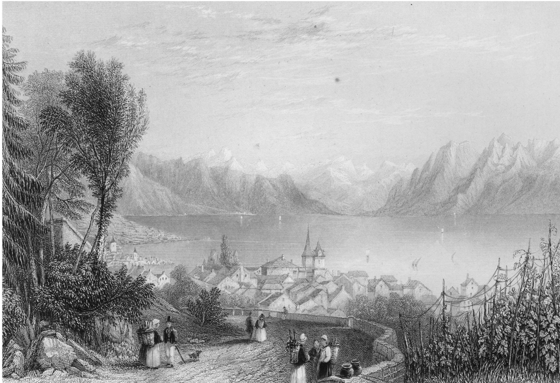
Fig. 9. William Henry Bartlett, « Lake of Lausanne above Paudex », in William Beattie, La Suisse pittoresque: ornée de vues dessinées spécialement pour cet ouvrage , Londres: George Virtue, 1836, 2 vol. BCUL.

Dans la seconde gravure, « Lake of Lausanne above Paudex », le peintre s'établit à nouveau en position surélevée, sur la route de Paudex ; encadrée à droite par des vignes et à gauche par des arbres, cette dernière est bordée d'un mur qui la transforme en une sorte de terrasse panoramique. Des habitants conversent, indifférents au paysage, à l'exception d'un homme et d'une femme, sans doute des touristes, qui semblent concentrés sur la vue qui s'étale devant leurs yeux : les toits du bourg de Lutry – reproduits ici avec ce goût du détail architectural si cher à Bartlett – puis le plan d'eau, parsemé ici et là de quelques voiles blanches à peine visibles, et enfin la vue étendue des montagnes qui ferment majestueusement l'horizon. Ces points de vue sont choisis sans nul doute pour exalter la beauté du Léman, comme le conseillait le théoricien du voyage pittoresque, Gilpin, qui écrivait « la beauté d'une vue, et surtout d'une vue de lac, dépend en grande partie, comme nous l'avons déjà observé, du point qu'on a choisi pour le voir » 38 .