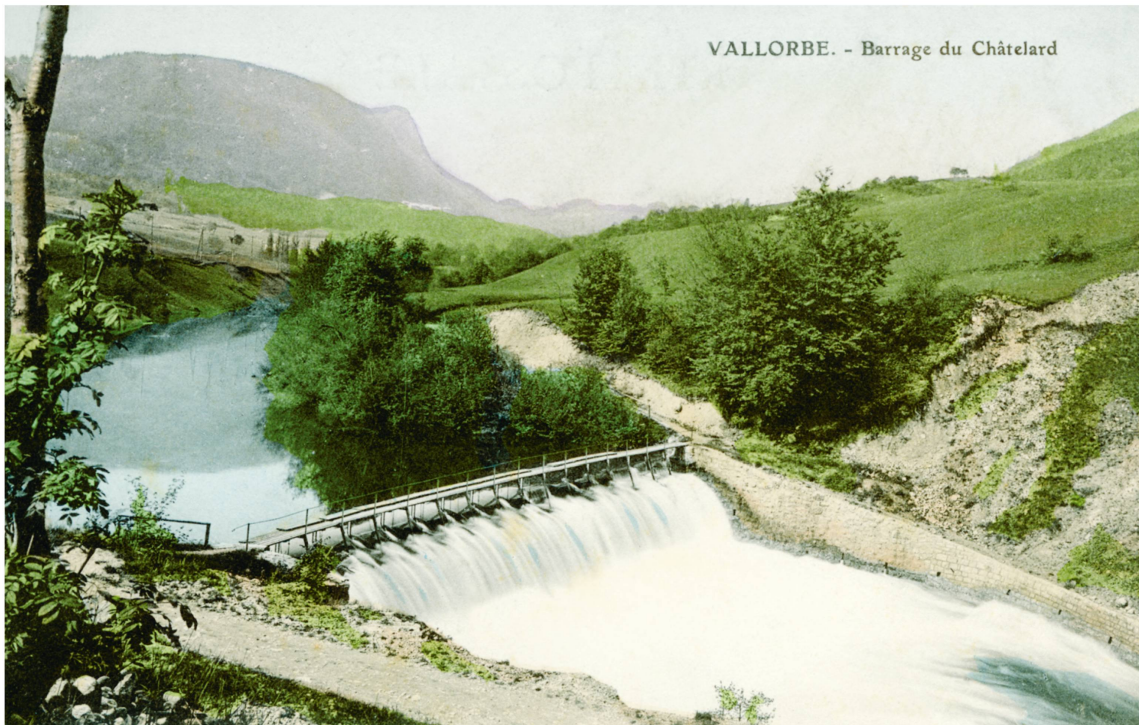
Le premier barrage de la Société électrique du Châtelard-près-Vallorbe, 1907.

l'eau s'engouffre dans un tunnel de dérivation de 290 m de longueur, s'élargissant sur ses dix derniers mètres pour servir de bassin de prise de charge. L'eau est ensuite conduite par une canalisation en tôle de un mètre et demi de diamètre et une chute d'environ onze mètres jusqu'aux deux turbines de 200 chevaux chacune. Au lieu-dit Le Châtelard, en aval du village, une usine électrique est construite. Le complexe comprend le bâtiment des turbines, des logements suffisants pour accueillir trois employés et leurs familles, une cave pour les denrées alimentaires, un atelier, un local de stockage pour les huiles ainsi qu'une écurie pour le bétail 34 .