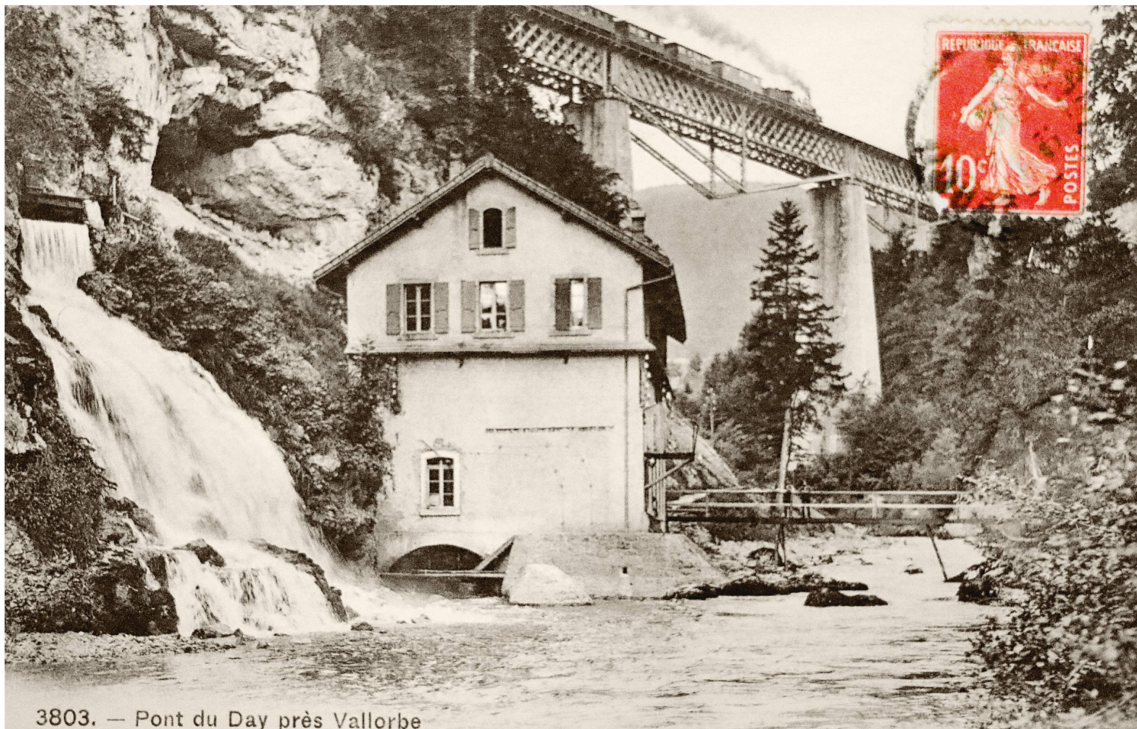
3803. — Pont du Day près Vallorbe Usine électrique du Châtelard-près-Vallorbe, avant 1923.

1521), aux Eterpaz (dès 1675) à Cugillon (dès 1681) ou au Moutier (dès 1689), toutes les principales usines vallorbières sont au fil de l'eau et utilisent la force hydraulique, et ce jusqu'à la fin du XIX e siècle 10 . Cette longue tradition industrielle de l'utilisation de l'énergie hydraulique va être bousculée par la Société Glardon & C ie , exploitante des mines de calcaire des Grands-Crêts.