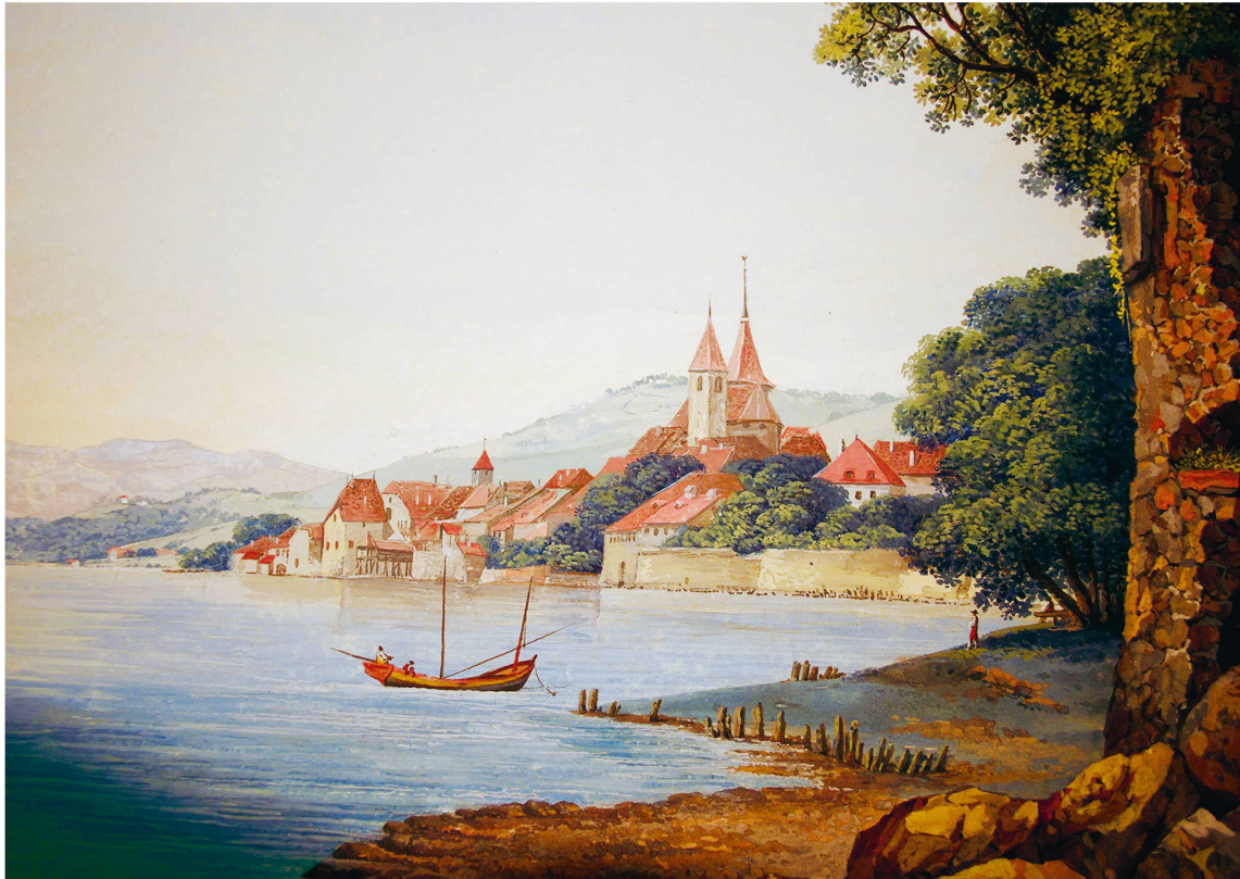
Carl Ludwig Hackert, Vue de Lustri peint d'après Nature , détail, 1792, gouache, 34,2 x 48,2 cm.

C'est principalement du premier courant migratoire que bon nombre de patronymes vignerons de Lavaux d'aujourd'hui trouvent leur origine. Entre le milieu et le tout début du XVI e siècle, il est constitué de « lombards » issus de la paroisse Saint-Georges du Devero dont le cœur se situe à Varzo, sur le versant aujourd'hui italien du col du Simplon. Ces chefs de feu n'avaient rien à voir avec les marchands et prêteurs des XII e et XIII e siècles, aussi qualifiés de Lombards, venus des villes de la plaine du Pô, qui s'installèrent aux péages afin de se livrer à leurs activités bancaires. Il s'agissait de maçons qui se déplaçaient en petites équipes de quatre ou cinq individus accompagnant un maître. Elles sont repérables dès le milieu du XV e siècle; les comptes de la confrérie du Saint-Esprit et ceux de la ville de Lutry mentionnent avec toujours plus de régularité ces équipes provenant d'Épesses dans la grande paroisse de Villette ou de Lausanne, engagées pour réparer l'église, les ponts, les fours ou les murs des fossés de la ville. Elles travaillaient aussi pour les gros propriétaires à refaire les murs de vignes, à réparer chemins et coulisses (rigoles) ou encore contribuaient aux travaux viticoles. Certaines furent même mobilisées en 1480 pour extirper (défricher) le pré de la Confré-