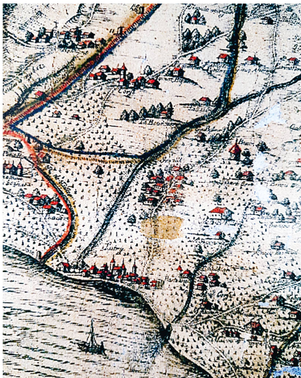
Abraham de Crousaz, Le Clerc & Crousaz, détail de la Carte du Ballivage de Lausanne : Avec les villes, les temples, les Chasteaux, les moulins, granges et maisons escartées, les forests, les ruisseaux, chemins, bornes et confins des lieux limitrophes, 1678.

La plupart des Lombards étaient alors des tâcherons et des vignolans, tels les frères Louis et Pierre Estrambin qui tenaient en amodiation les maisons, truit (pressoir) et vignes du Dézaley des religieux de l'abbaye de Montheron en 1534, alors qu'en 1550 leurs descendants, Laurent et Janin, poursuivaient le même labeur sur le domaine passé à LL.EE. 20 . Le recensement des habitants et des maisons de la grande paroisse de Vilette établi vers 1537 rend compte de ce statut caractéristique du milieu lombard. Au service des grands propriétaires viticoles de Lavaux, ils conservaient leur place de vignolans, même après avoir acquis vignes et maison, en la transmettant au sein de la famille.