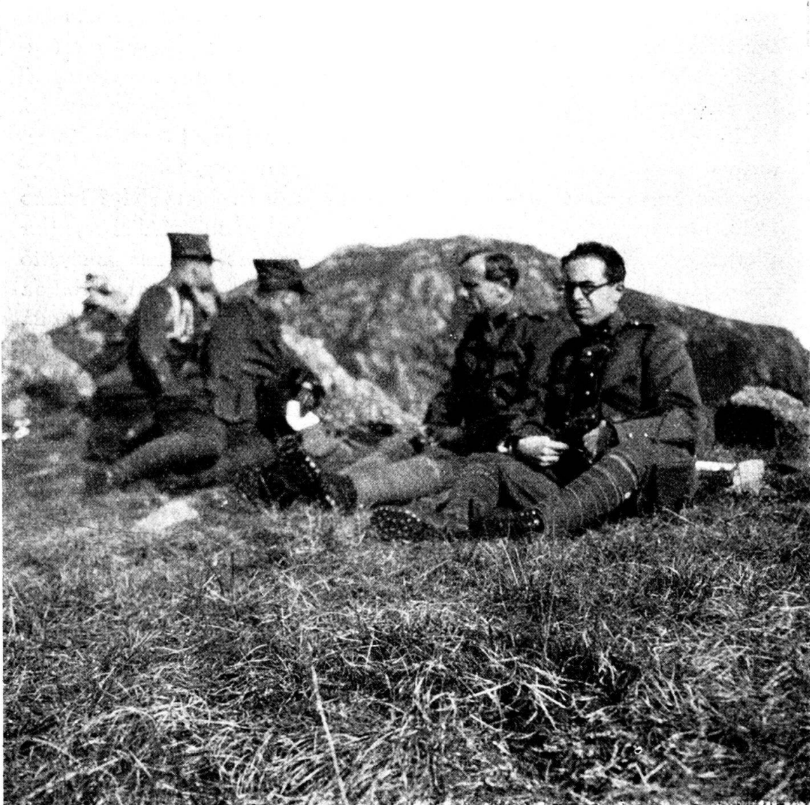
Alle manovre. Sosta.

Rinviato lo scorso marzo a causa di una leggera epidemia di grippe che serpeggiava fra la popolazione, il corso di ripetizione del Reggimento 30 ebbe luogo dal 28 ottobre al 9 novembre. Il rinvio è stato in due sensi felice, ha permesso al reggimento di presentarsi al completo, cioè anche col Bat. 94 il quale, se il corso avesse avuto luogo in marzo, avrebbe prestato servizio per proprio conto e ci ha fatto incontrare un bellissimo periodo di tempo autunnale, che ha be-