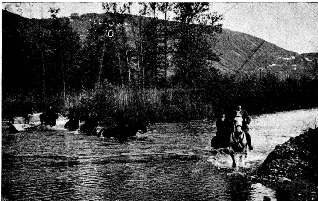
Equitazione acquatica . . .