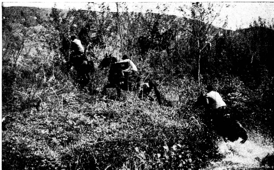
Dall'acqua al bosco . . . .

Un corso più « bello » dei precedenti. Più interessante perchè più variato, più emozionante perchè tutto tirato al « gran galoppo », più militare perchè la disciplina ha temprato in ogni momento volontà e coraggio dei partecipanti.