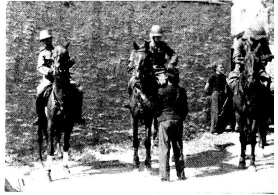
I cavalieri sono in sella...