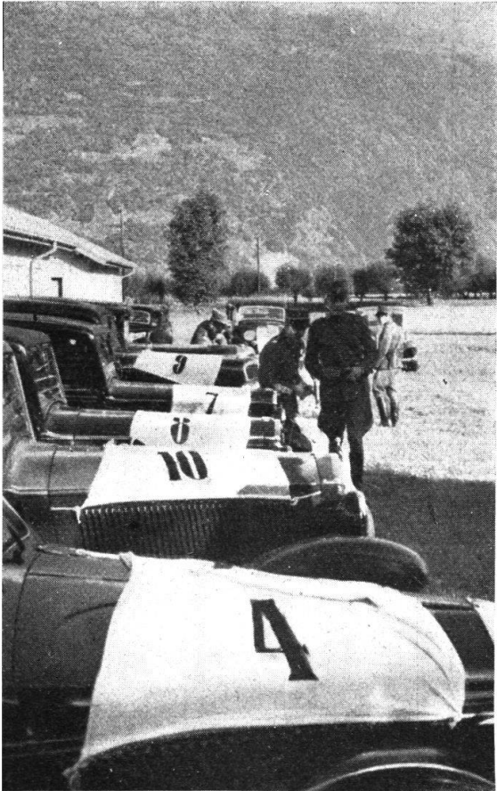
Le macchine ben allineate...