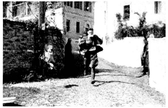
I ten. Forni e Lanzi arrivano a Torricella

Un puntino nero viene giù attraverso i prati, si nasconde dietro i Mt. Moneda, ricompare per buttarsi giù subito verso il fondo