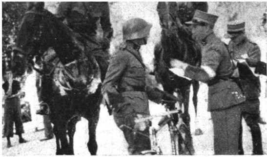
I cavalieri sono arrivati