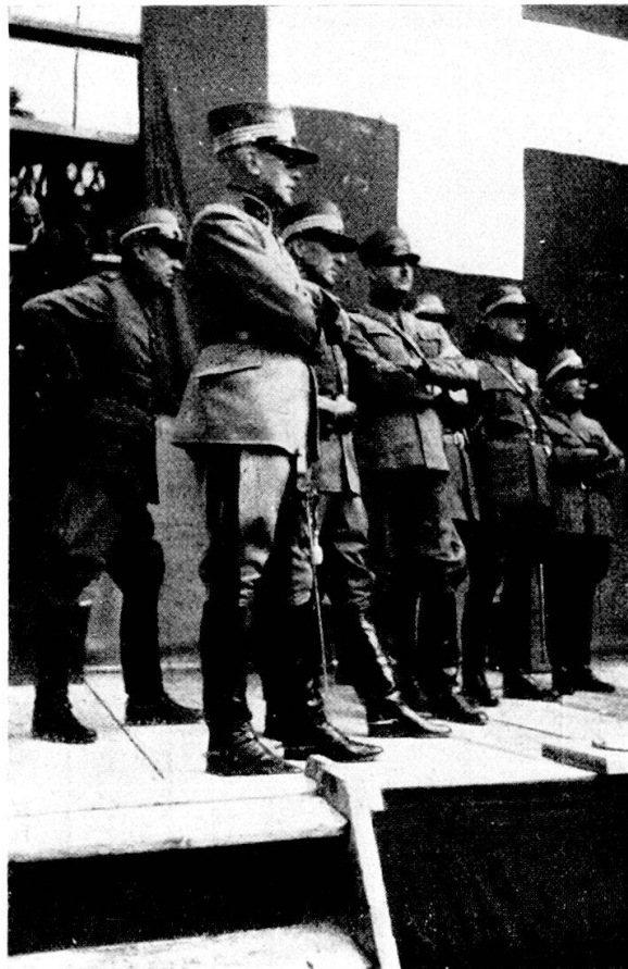
Le autorità militari