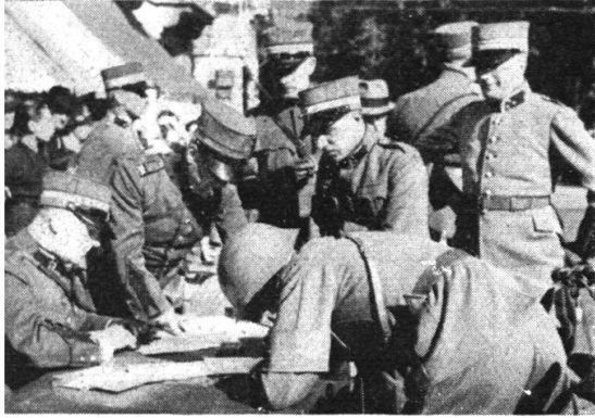
Al controllo di arrivo