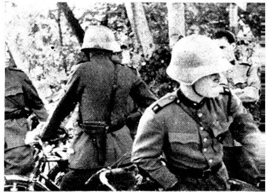
I ciclisti aspettano...