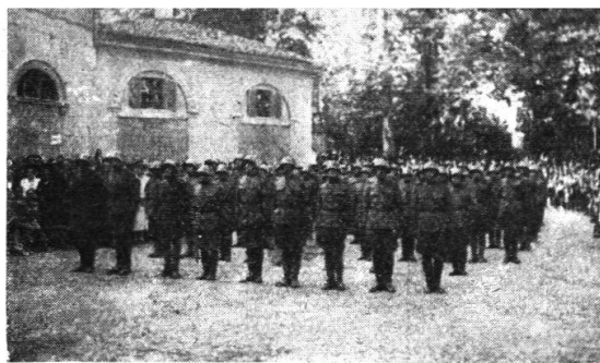
Il robusto quadrato dei concorrenti

La bella piana del Vedeggio con il suo giallo ed il suo verde sporco di autunno ha visto la contesa elegante dei cavalieri. Il troppo amore alle bestie ha limitato purtroppo la passionalità della contesa. I concorrenti, che avevano almeno due cronometri ai polsi con minimi due pulsanti sono stati però non solo dei buoni capi-treno che hanno saputo arrivare in orario ma anche degli eccellenti cava-