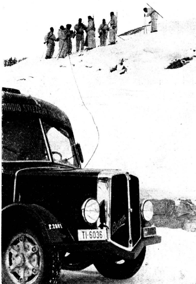
L'autovettura della R. S. I. stabilisce il collegamento tra la truppa e la popolazione.

Nella Svizzera italiana la presa di contatto tra gli ascoltatori mobilitati e quelli civili, promossa dalla Sezione Radio, si è avuta attraverso due rubriche regolari: la prima, intitolata „Posta da campo” (più tardi „Vita militare”), faceva conoscere alla popolazione il grado di prontezza dell'esercito e infondeva fiducia con la descrizione delle armi nuove e dei moderni metodi di combattimento (furono incaricati delle radiocronache gli „ufficiali radio”); la seconda rubrica, intitolata „Dal fronte interno” faceva conoscere il pensiero, la voce, l'affetto del paese per i suoi soldati. Non fu facile trovare il tono giusto in questi programmi, ma anche se