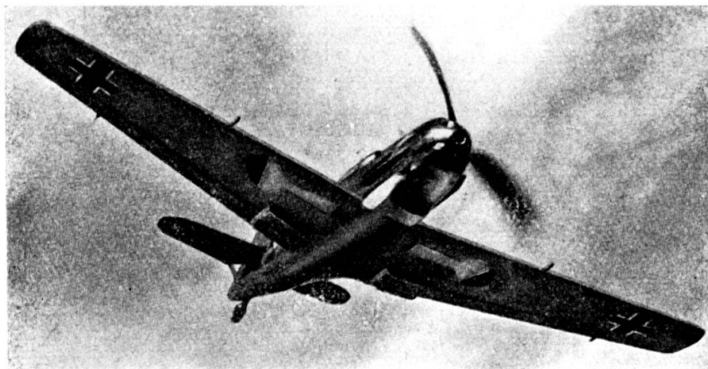
Cacciatore MESSERSCHMITT „Me 109“ dell'aviazione dell'asse