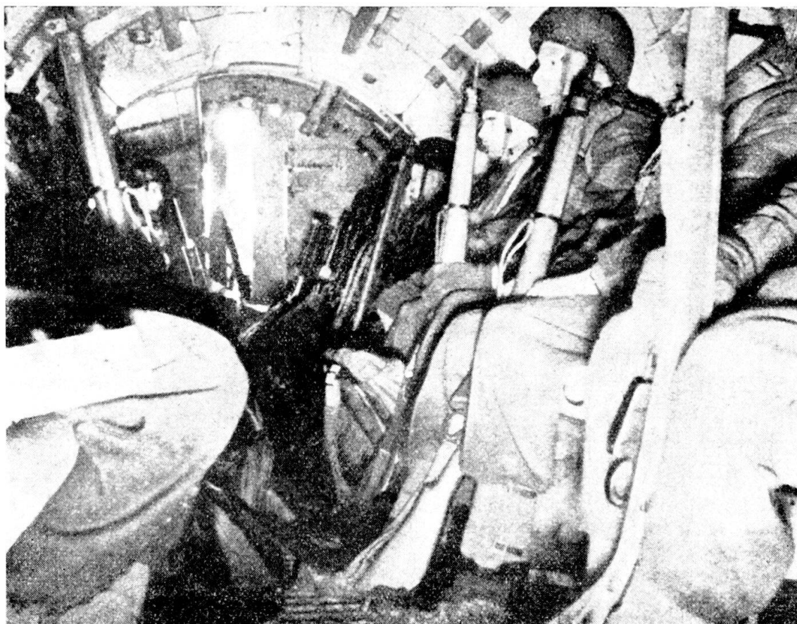
Aliante per il trasporto di truppe: possono essere trasportati fino a 30 uomini per volta.

di Kassel. Il primo obiettivo era l'accerchiamento della Ruhr per assicurare l'offensiva verso oriente.