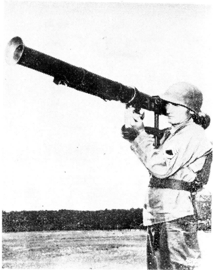
Lancia-razzi anticarri « Bazooka ».