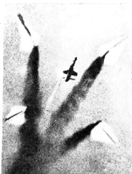
Dal razzo se ne staccano altri 4 di minori proporzioni.