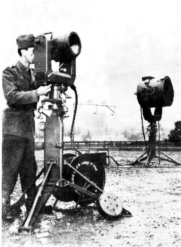
Telescopio elettronico con riflettore di raggi infrarossi