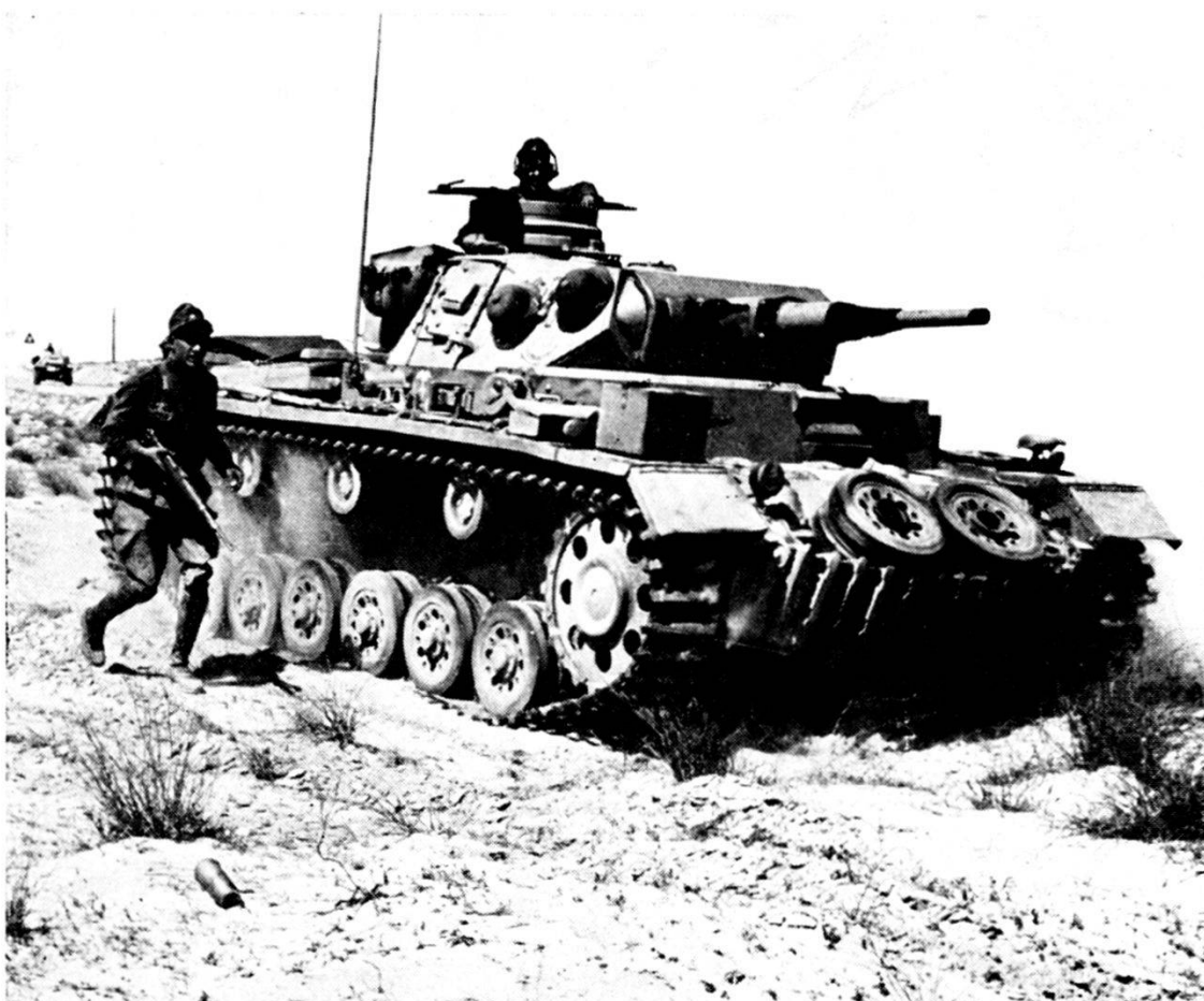
Germania: carro armato «MARK IV» dotato di cannone 75 mm Truppe dell'Afrikakorp in Libia