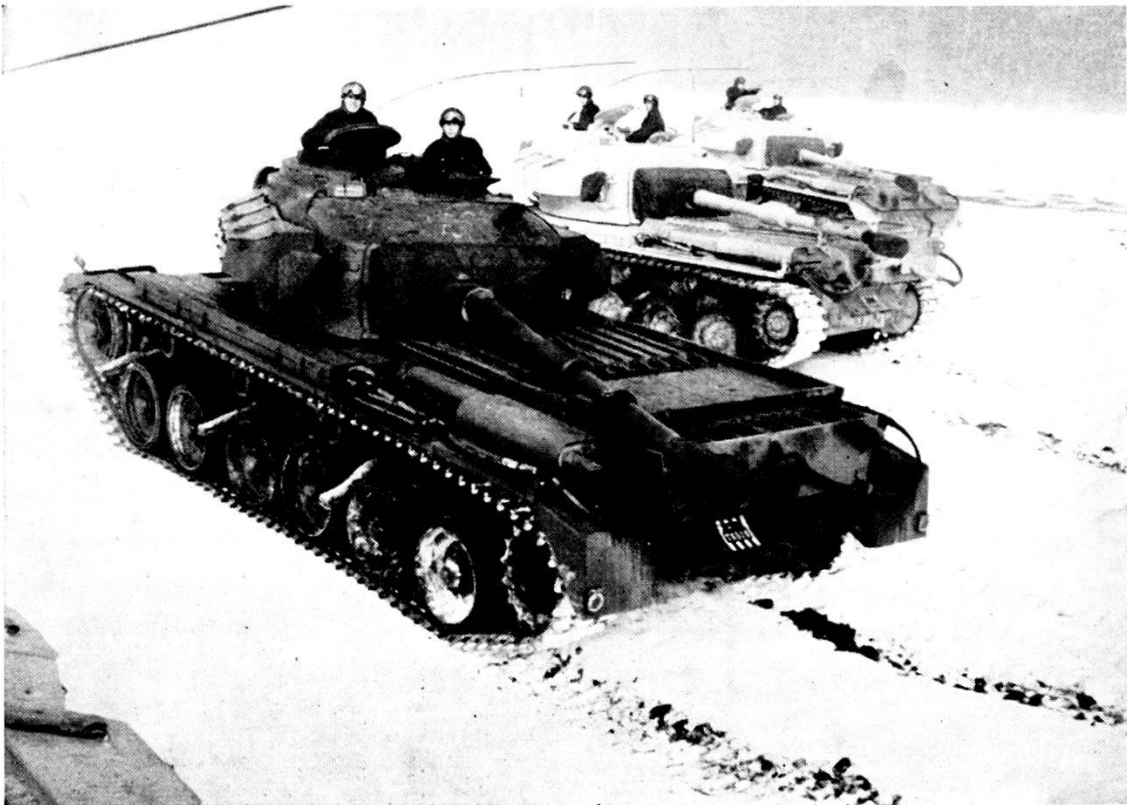
Svizzera: Carri armati «Centurion» in una scuola reclute