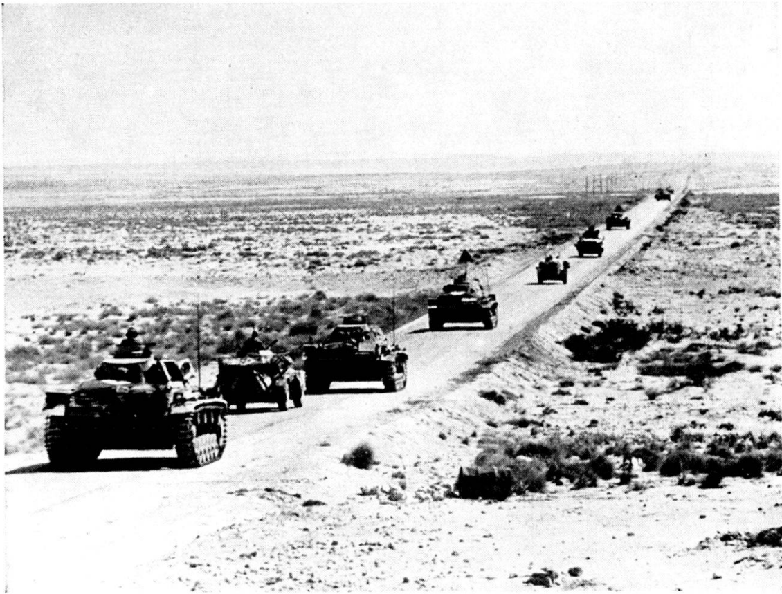
Germania: carri tedeschi nel deserto Cirenaico