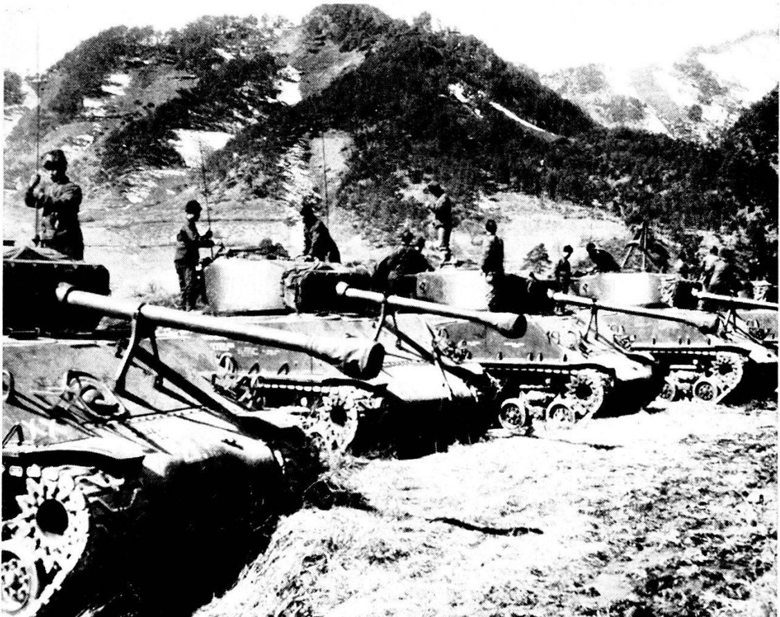
Stati Uniti A.: carri « Sherman » nella campagna di Corea. Peso 30 t.; cannone 75 mm