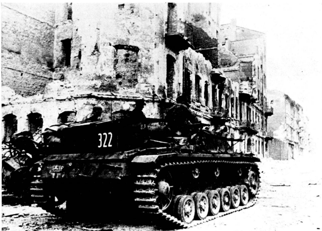
Polonia 1939: cannone d'assalto germanico nelle vie di Varsavia (ATP)