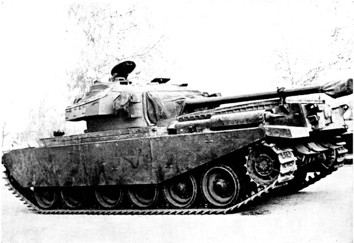
Svizzera: Carro « Centurion » visto dal dietro con cannone in posizione di marcia.