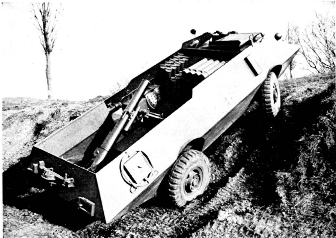
Svizzera: lanciamine pesante 12 cm semovente (scafo « MOWAG »)