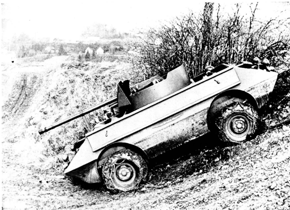
Cannone anticarro 9 cm semovente. Scafo « MOWAG » (Motorwagenfabrik AG. Kreuzlingen) a doppia guida.