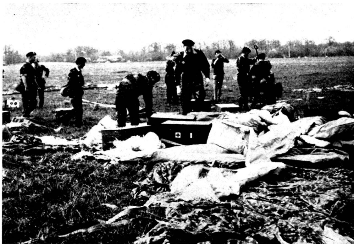
Il materiale paracadutato