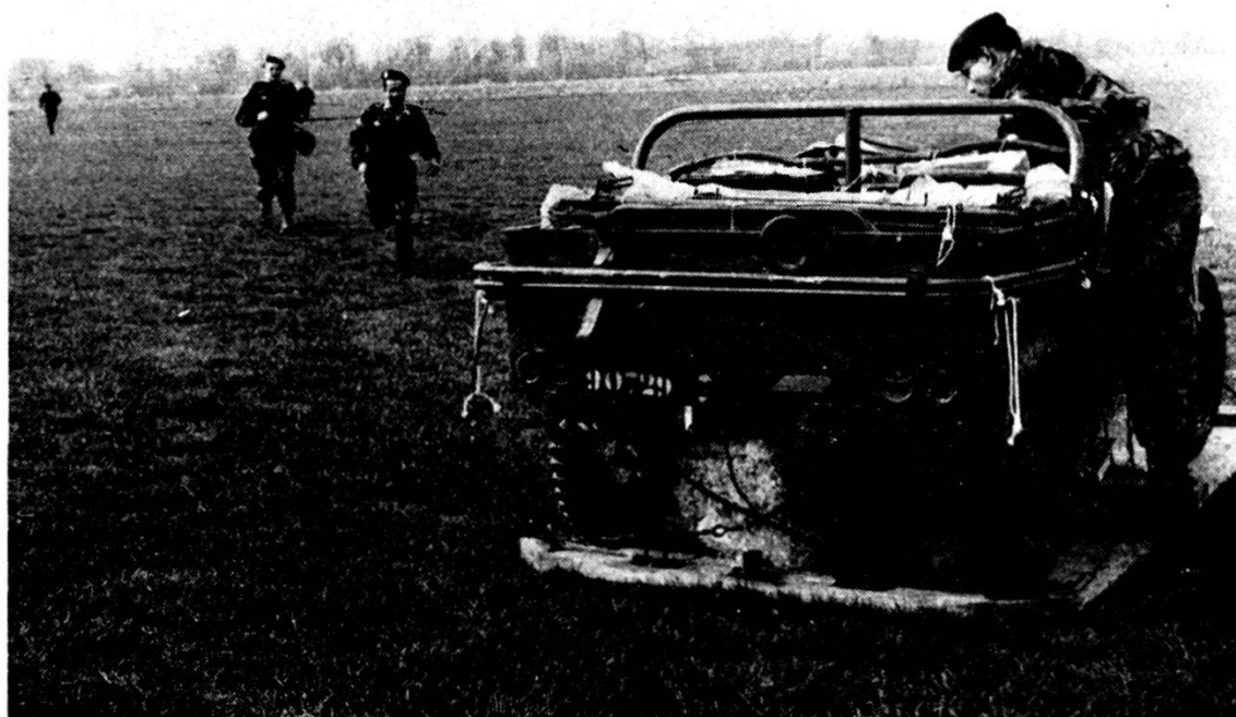
Jeep del materiale paracadutata