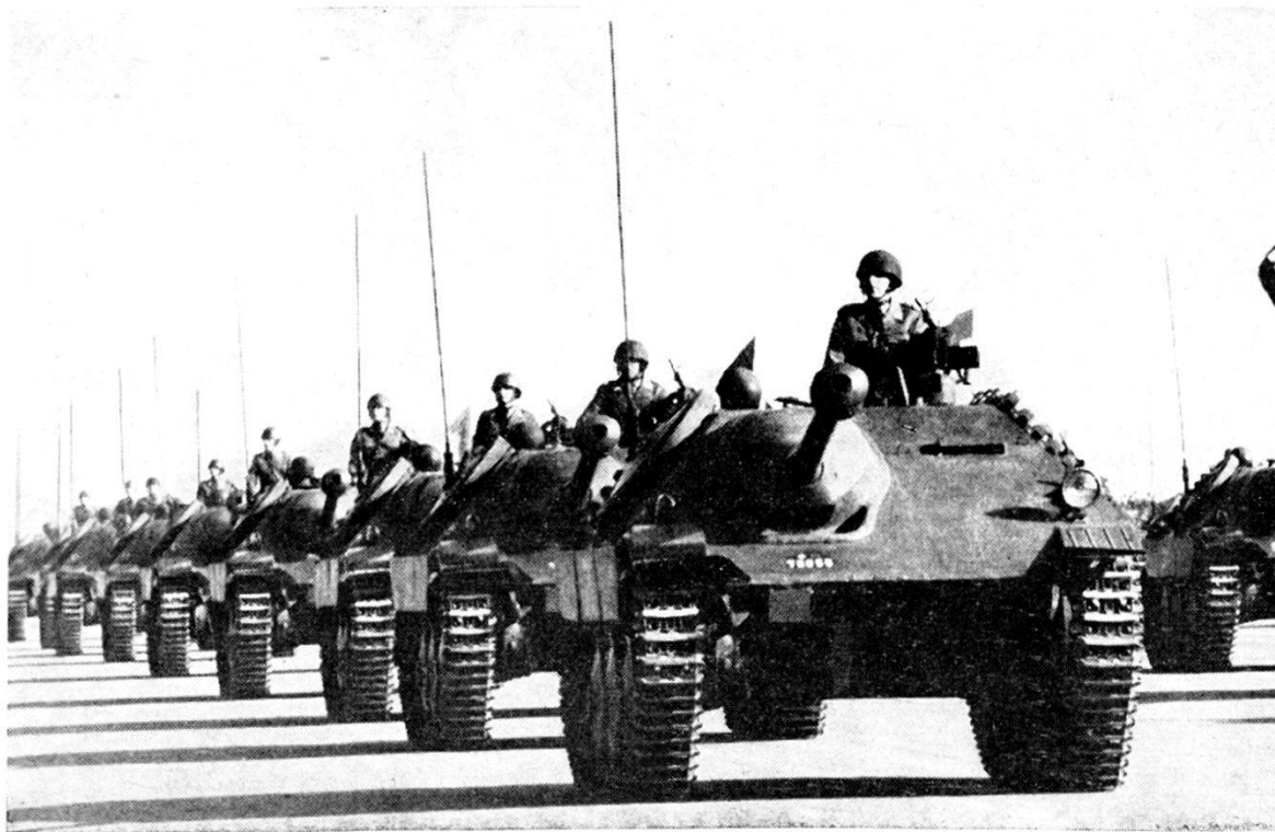
Cacciatori di carri armati G 13

Nell'ultimo fascicolo (copertina e pag. 261) i cacc. c. arm. G 13 sono diventati AMX 13. Nel ripetere quell'illustrazione e l'altra della pag. 262 approfittiamo per aggiungere alcuni dati sui due veicoli, richiamando quanto su di essi è stato detto a pag. 64 e 65 fasc. II 1962.