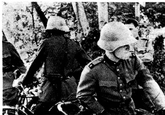
I ciclisti aspettano...