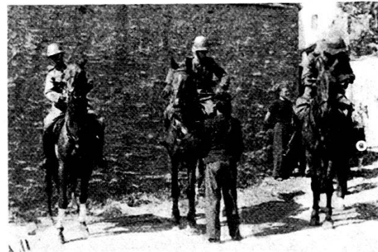
I cavalieri sono in sella...