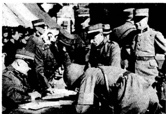
Al controllo di arrivo