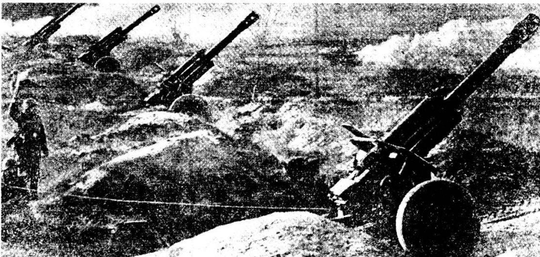
Obici 152 mm, M 1943 (D-1) in posizione. Pezzo con canna corta e freno di bocca pluriforato. Ritenuto obice di medie prestazioni.

Sono particolarmente pericolosi i fiumi ed i torrenti di montagna ed i letti asciutti di questi corsi d'acqua; sovente possono diventar pericolosi anche semplici infossamenti. Ma il terreno di montagna non costituisce unicamente ostacolo all'esplorazione: al contrario, spesso offre condizioni favorevoli per l'impiego degli esploratori. In particolare, esso permette di infiltrarsi nel dispositivo avversario senza farsi notare, di impiegare pattuglie e di eseguire imboscate e colpi di mano. Naturalmente, con le caratteristiche del terreno devono essere tenute in considerazione anche quelle climatiche. L'esperienza e l'istruzione di montagna approfondita, sono importanti premesse per il successo.