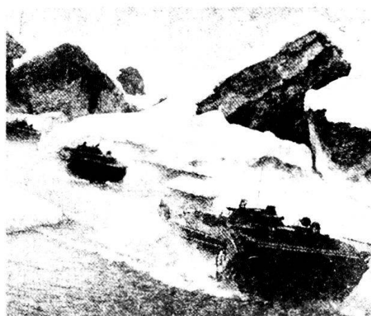
Fuc mot superano un valico con i loro carri armati granatieri BMP.