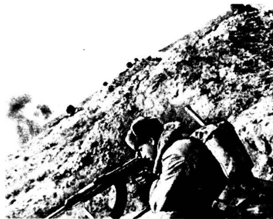
Fuc mot in difesa in montagna. Si esercita molto il tiro dall'alto, ciò che viene sovente criticato da autori militari sovietici.