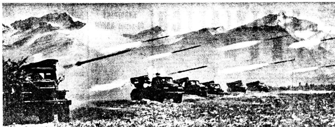
Lanciarazzi multipli 122 mm - BM_21 in posizione di tiro. Portata 11 km.

I distaccamenti di aggiramento richiedono molto tempo perciò devono essere impiegati con relativo anticipo. La loro azione a sorpresa diventa sovente determinante per il successo generale. Non è però facile penetrare nel dispositivo di difesa senza farsi notare dal nemico, anche se esistono brecce e intervalli; fanno parte dell'azione di aggiramento, attacchi simulati e fuochi di sorpresa per di-