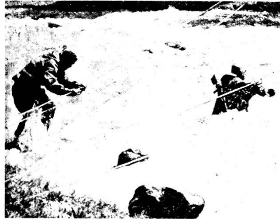
L'istruzione individuale è dura e realistica. Il soldato sovietico l'accetta di buon grado. Qui, il passaggio di un fiume di montagna.