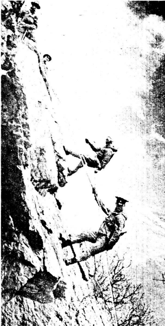
Istruzione di alta montagna di fuc mot sovietici.

Missioni analoghe a quelle dei reparti di avanguardia sono affidate anche a reparti aeroportati . In questo campo ci saranno nel prossimo futuro nuove importanti possibilità, perché il tempo lavora a favore dello sfruttamento della terza dimensione.