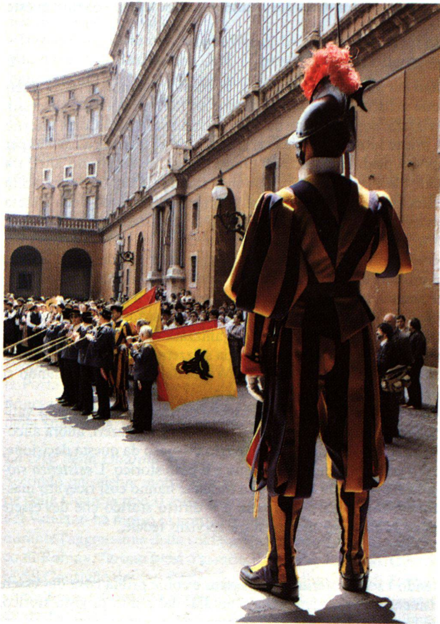
Visita di un gruppo folcloristico.