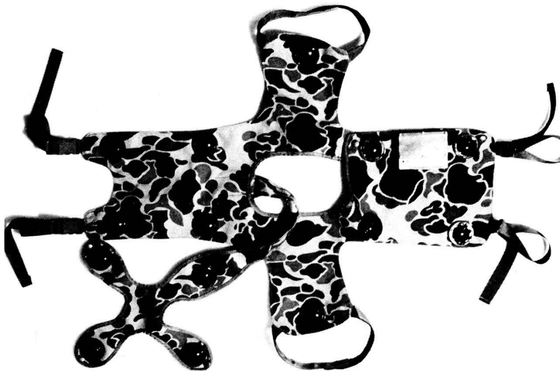
Simulatori per l'istruzione di combattimento con il fucile d'assalto 90: il giubbotto con i ricevitori di raggi Laser