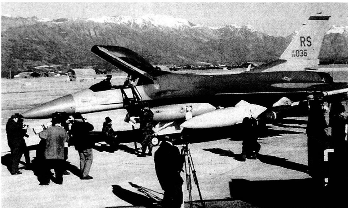
Intervista ad una squadra di manutenzione di un F-16 del 256° squadrone caccia.

Vi sono, poi, nell'ambito della Direzione della Dinfos altre strutture: il Reparto Comando (che coordina i programmi di certificazione degli studi e assicura appropriati istruttori per ogni aspetto della vita accademica della Dinfos); il Consigliere per la Riserva che, sotto la Direzione del Comandante della Scuola, coordina i diversi corsi brevi per le diverse componenti (ad esempio dal 1979 hanno