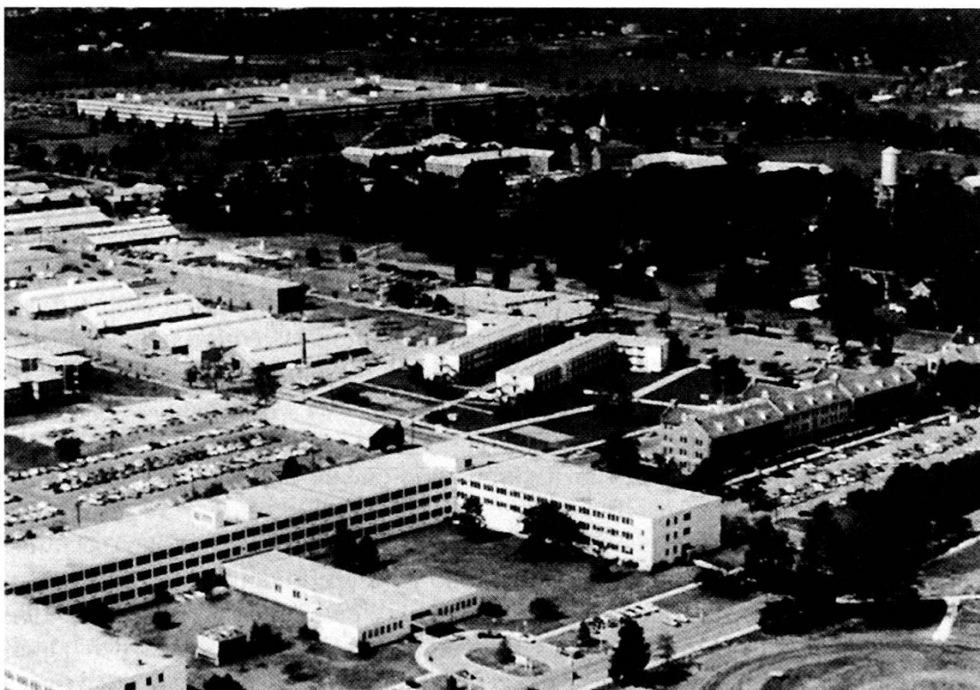
Veduta aerea di Forte Harrison; in primo piano le strutture che ospitano la Defense Information School.

mane poi prepara Ufficiali, Sottufficiali e funzionari civili per occupare posizioni di management nella gestione e nella produzione di programmi e attività audiovisive dell'AFRTS ( Armed Forces Radio Television Service , Servizio Radio Televivo delle Forze Armate statunitensi). Inoltre esiste un corso specifico, lo ship-board information che è destinato al personale della Marina. Questa specifica attività didattica della durata di una settimana, serve alla preparazione di personale, che deve comunque essere già in possesso del livello formativo giornalistico di base, per la redazione di programmi radio-tv e di bollettini e giornali a bordo di unità della Marina (per ovvi motivi questo servizio esiste sulle navi di maggiori dimensioni, in pratica ne sono escluse solo le unità antimine e litoranee/portuali). Un corso di due settimane introduce gli allievi nelle tecniche più avanzate del giornalismo manuale e del giornalismo elettronico nel quale vi è un larghissimo impiego di mezzi, tecnologie e filosofie innovative. Vi è poi una serie di corsi