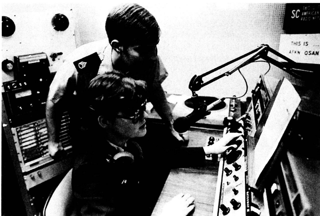
La capacità di utilizzo dei moderni sistemi di comunicazione si ottiene con la partecipazione ad un apposito corso basico radiotelevisivo.

Il Generale Eisenhower, Comandante supremo alleato, proprio la sera precedente allo sbarco sulle coste normanne, il 5 giugno di quarant'anni fa, parlò a lungo con i diversi corrispondenti di guerra, civili e militari accreditati presso il suo comando, sottolineando il ruolo sempre più importante che la stampa e la comunicazione hanno in una società democratica soprattutto quando essa è impegnata in sfide