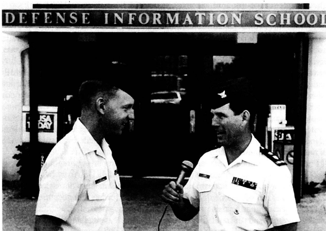
Una intervista durante il corso destinato ad Ufficiali e Sottufficiali che operano a supporto della Guardia Costiera.

geografica ha visto abbastanza recentemente mutare la sua appartenenza e dipendenza. Infatti dal 1. ottobre 1992 l'American Forces Information Service ha assunto il controllo operativo della Dinfos, che invece dal punto di vista didattico dipende dal Dipartimento Scuole della Difesa dove l'Assistente per gli Affari Pubblici del Segretario alla Difesa è il massimo responsabile politico-amministrativo.