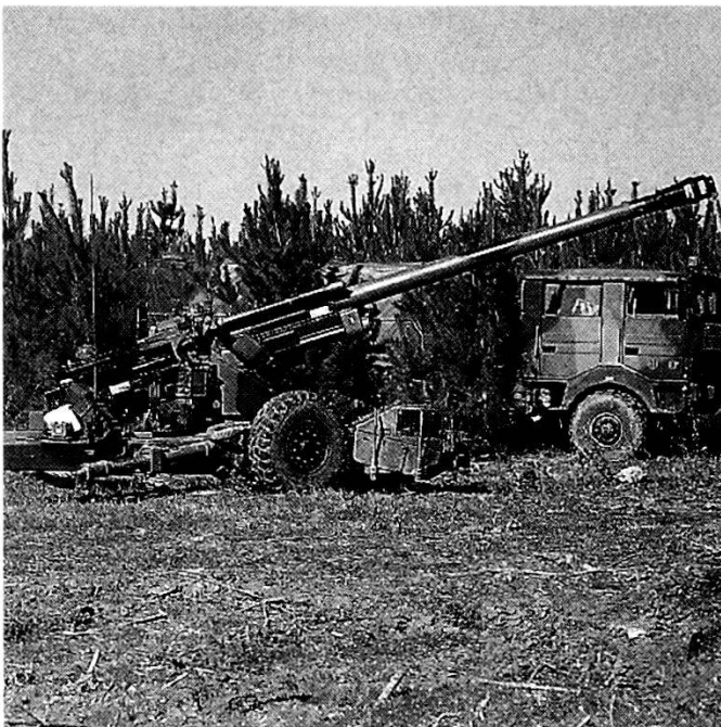
Cannone francese TR F1 da 155 mm.

mitate nel tempo come sarebbe auspicabile. Dopo la proiezione d'urgenza bisogna, sempre più spesso, stabilizzare la propria presenza ed effettuare rotazioni dei contingenti impegnati in queste operazioni. Ritengo quindi che, una volta realizzata la proiezione di forza, che richiede la disponibilità di personale di carriera in grado di operare tridimensionalmente, ci debba essere all'interno degli scaglioni successivi una capacità operativa assai ampia, che vada dall'impiego dell'artiglieria a quello di forze blindate; e questo è un concetto valido per tutte le formazioni dell'Armée de Terre. Solo per citare un esempio, i nostri specialisti del servizio carburanti sono tra quelli che hanno svolto il maggior numero di missioni oltremare.