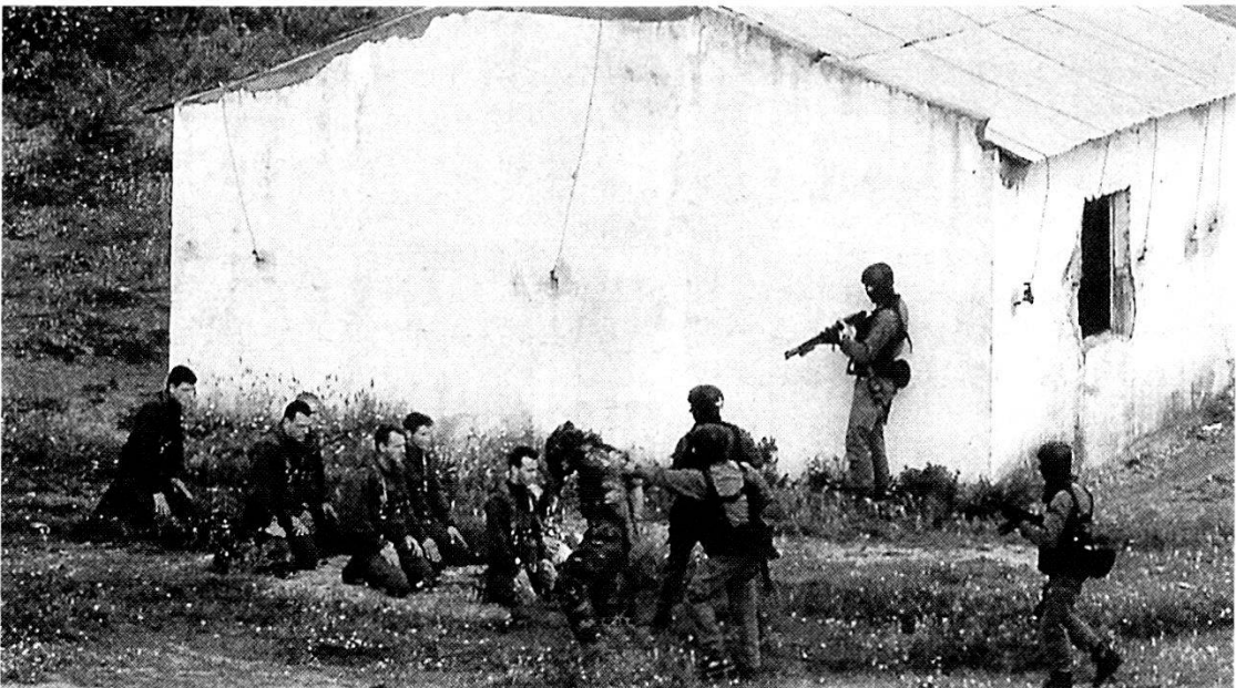
Soldati delle forze speciali francesi impegnati in un rastrellamento, nel corso dell'esercitazione «Farfadet 92».