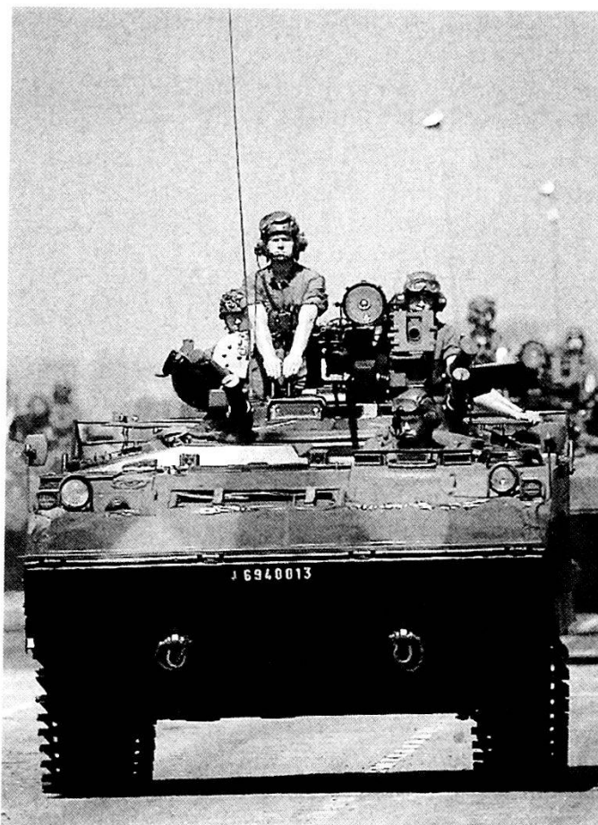
I blindati in dotazione alla Forza di Azione Rapida francese comprendono l'AMX 10 ruotato.

Bisognerà dunque ricorrere a soluzioni sostitutive alle quali si potrà utilmente aggiungere il concetto delle JCTF.