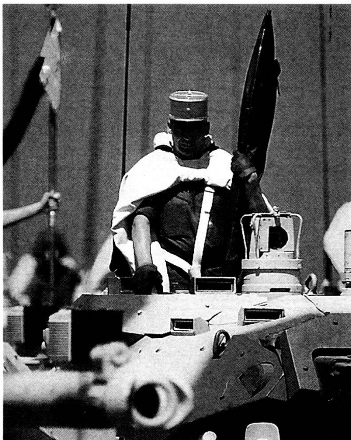
Uomini del 1. Reggimento «Spahis» francese, durante la tradizionale sfilata del 14 luglio.

L'evoluzione geostrategica globale, al momento, non ha influenzato in maniera rilevante le strutture della FAR, che si è rivelata, alla prova dei fatti, ben organizzata, equipaggiata e armata.