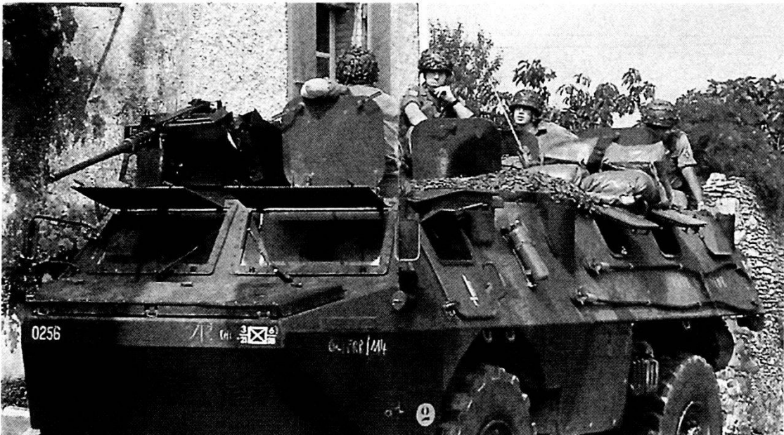
La Forza di Azione Rapida francese dispone di blindati «Sagaie», a sei ruote motrici, e VAB, a quattro ruote motrici, qui sopra.