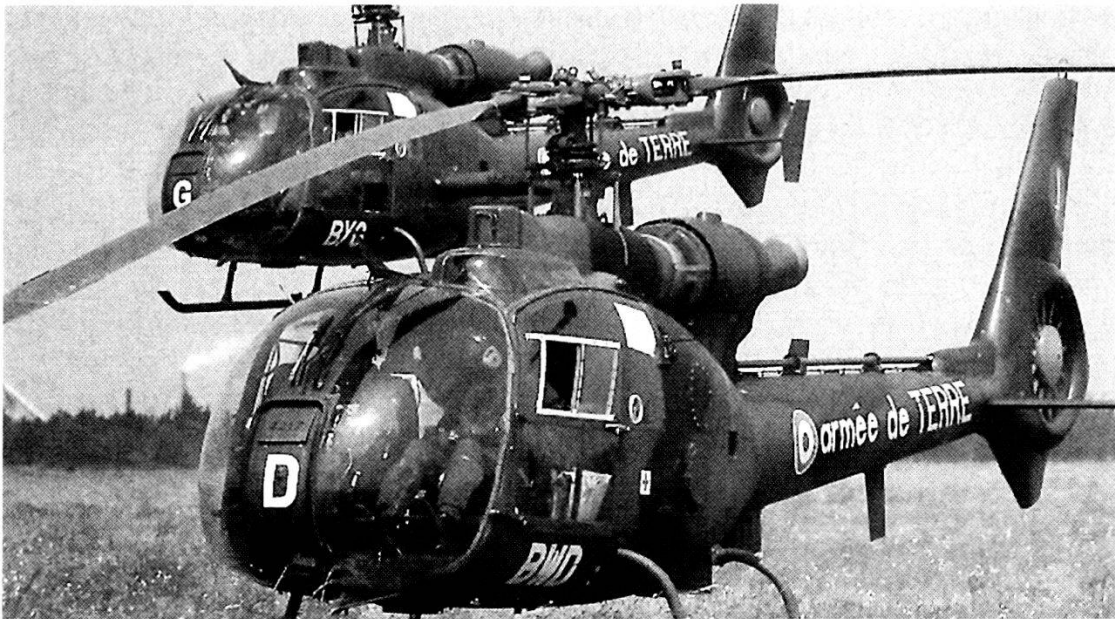
Gli elicotteri «Gazelle» costituiscono la componente ad alla rotante della FAR.