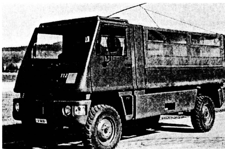
Autoc 2,2 t fstr 4x4 Bucher DURO.

Per quanto riguarda la fanteria di montagna, l'accresciuto bisogno di mobilità verrà raggiunto con l'introduzione del nuovo veicolo Bucher DURO, che sostituirà gradatamente gli oramai vetusti Pinzgauer. Anche al PAEs di Bellinzona sono apparsi i primi veicoli di questo tipo. Viste le sue dimensioni (può infatti trasportare 16 militi) e le sue particolarità tecniche, la formazione dei conducenti avverrà solamente nelle scuole e nei corsi fuori Servizio. Non verrà organizzata alcuna formazione di nuovi conducenti durante i CR. La truppa riceverà questo nuovo veicolo a partire dal 1997.