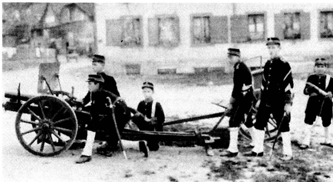
Cadetti all'esercizio con cannone (1913).

una speciale «Commissione dei cadetti», formata da personalità civili e militari della città di Berna. All'inizio di ogni anno veniva allestito di comune accordo un programma d'istruzione con manovre ed esercizi. Il finanziamento era coperto da doni e lasciti e, per il resto, dalla città di Berna. L'armamento di ogni cadetto era costituito dal fucile, mentre gli ufficiali portavano la spada in dotazione nell'esercito.