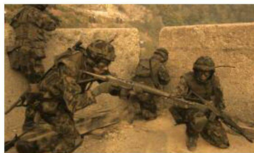
Fase d'istruzione al cdt di località.

Nell'IDR, della durata di 8 settimane, vengono applicate e messe in pratica le conoscenze apprese con lo svolgimento di differenti esercizi d'impiego tra i quali gli esercizi finali "FALCONE", "TORCHE" e "HAMMER". Durante questa fase di istruzione alle reclute granatieri vengono affiancati i quadri di milizia in servizio pratico, così da formare un'unità d'impiego completa.