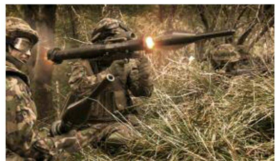
Specialisti PzF in azione.