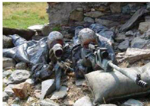
Team di tiratori scelti in posizione con il fucile tiratori scelti 04.

Lo stage si svolge completamente all'aperto. La giornata è dedicata a svariate istruzioni tecniche e durante la notte i