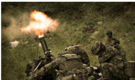
Durante la scuola ufficiali i futuri capi sezione apprendono le tecniche d'impiego di tutte le armi del bat granatieri. In questo caso il lm 8,1cm.

Prima dell'avvento di Esercito XXI ai granatieri mancava una capacità "tiratori scelti" a lunga distanza. Questa lacuna è stata colmata con la messa in atto di un ambizioso programma di formazione e di equipaggiamento. La formazione si suddivide in due corsi ben distinti, il primo dedicato a tutti i tiratori scelti delle Forze Terrestri (6 settimane) e il secondo indirizzato specificatamente ai granatieri e con la specializzazione al tiro a lunga distanza.