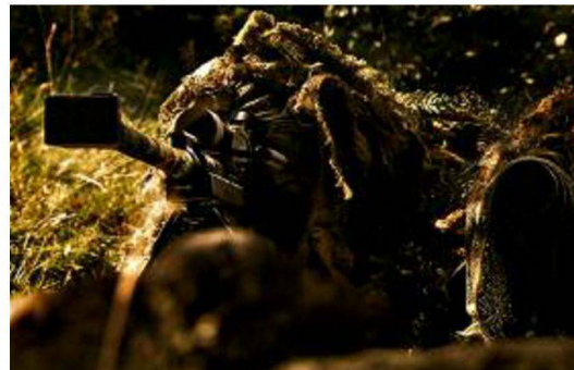
Team di tiratori scelti in posizione con il fucile di precisione 04.