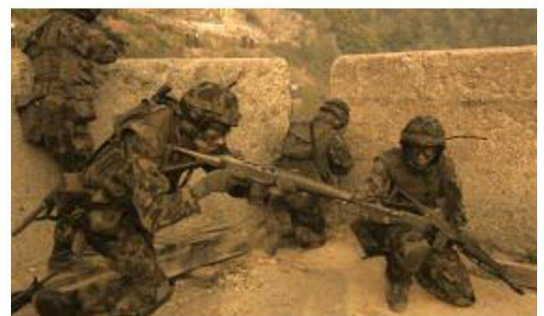
Fase d'istruzione al cdt di località.

Nell'IDR, della durata di 8 settimane, vengono applicate e messe in pratica le conoscenze apprese con lo svolgimento di differenti esercizi d'impiego tra i quali gli esercizi finali "FALCONE", "TORCHE" e "HAMMER". Durante questa fase di istruzione alle reclute granatieri vengono affiancati i quadri di milizia in servizio pratico, così da formare un'unità d'impiego completa.