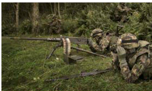
Granatieri specializzati alla mitragliatrice 12,7mm 64.