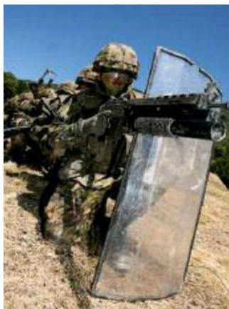
Équipe munita di scudo protettivo si prepara ad un'entrata dinamica in un edificio.

La terza operazione, nome di copertura "HAMMER", si svolge nell'ambito di operazioni di difesa sulla pz d'Armi di St. Lutziesteig presso il villaggio per il combattimento di località.