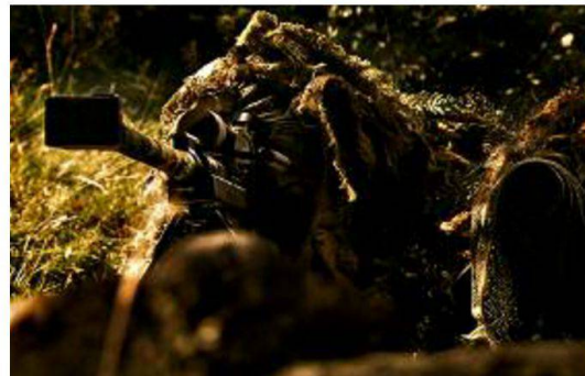
Team di tiratori scelti in posizione con il fucile di precisione 04.