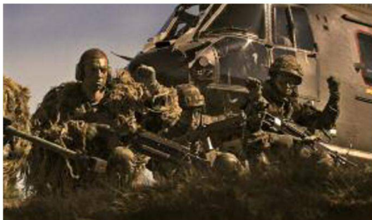
Granatieri sbarcati da un elicottero SP Cougar si apprestano ad entrare in azione.

Dopo aver eseguito, durante due settimane, una formazione di base in qualità di esploratore/organo di comando per il futuro tiratore scelto granatiere la formazione dura 9 settimane e le prime 4 sono caratterizzate dall'istruzione di base comprendente l'insegnamento teorico e pratico al fucile tiratori scelti 04 in calibro 8,6mm. Le reclute, inoltre, approfondiscono le conoscenze relative alla lettura carte, al camuffamento, al bivacco in montagna e alla costruzione di un posto d'osservazione. La quinta settimana è caratterizzata da tiri a lunga distanza in calibro 8,6mm sulla pz d'armi di Hinterrhein. Nella sesta settimana durante un esercizio d'impiego di tre giorni il candidato tiratore scelto metterà in pratica quanto appreso nella prima fase di formazione. Le successive tre settimane sono dedicate unicamente all'istruzione al fucile di precisione 04 in calibro 12,7mm. Ogni granatiere tiratore scelto, durante questo periodo d'istruzione, effettuerà circa 400 tiri con il fucile tiratori scelti 04 in calibro 8,6mm e 200 con il fucile di precisione 04 in 12,7mm.