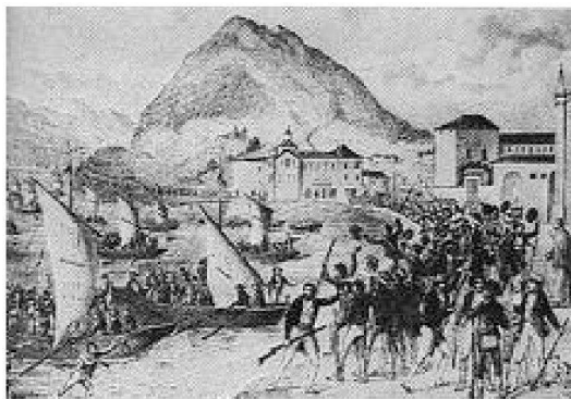
Sbarco di insorti a Lugano durante i moti luganesi del 1839

sa alla Lombardia. Con l'atto di mediazione nasceva ufficialmente il cantone Ticino e i nuovi obblighi e nuovi diritti spettavano alle popolazioni. La frontiera con il Regno italico era fonte di continue discordie; attraverso di essa passavano di continuo merci inglesi di contrabbando e disertori militari. Molti erano fuggiaschi filo-austriaci dalla Lombardia che trovavano accoglienza a Lugano dove una forte fazione filo-austriaca faceva propaganda contro Napoleone. L'imperatore nel 1810 disturbato dal contrabbando tollerato dal Ticino, inviò un contingente di truppe ad occupare il cantone fino alla fine del 1813. Ma dopo la sconfitta subita da Napoleone a Lipsia anche gli ultimi distaccamenti dell'armata del Regno d'Italia lasciarono il cantone per andare a sorreggere l'impero. ■