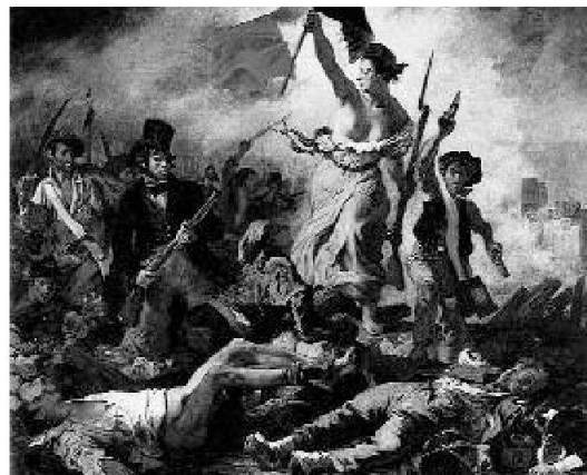
Efficace immagine della presa della Bastiglia nel 1789

Il servizio militare all'estero forniva uno sfogo all'eccedenza di popolazione e rimpinguava le finanze. L'industria tessile si sviluppava a Basilea, Zurigo e nella Svizzera orientale, quella dell'orologeria a Ginevra e a Neuchâtel. Nelle campagne si dissodavano nuovi terreni e la produzione era sufficiente a coprire il fabbisogno della popolazione. Nasceva la borghesia, erano borghesi i cittadini che godevano di privilegi in virtù del potere economico. Politicamente il popolo elvetico era governato dalla Dieta che riuniva i rappresentanti dei tredici cantoni e degli alleati più importanti. Un organismo pieno di difetti, che male avrebbe retto al temporale che stava per abbattersi su tutta l'Europa. Il 14 luglio 1789 il popolo di Parigi si scatenò e distrusse la Bastiglia, la prigione di stato, simbolo