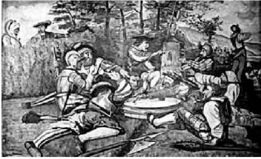
Soldati del '600 in battaglia si rifocillano durante una pausa

le nazioni. Unico punto debole era l'amministrazione della giustizia. I Landfogti che venivano dai cantoni sovrani stavano in carica due anni e dovevano quindi ripartire prima di essersi impraticchiti della lingua, degli usi e costumi dei sudditi. Inoltre in quel breve periodo cercavano di arricchirsi il più possibile. Era costume infatti che chi poteva pagare di più sicuramente otteneva la ragione nelle cause sia civili che penali. A volte i "sindacatori", preposti al controllo, arrivavano anche a punire gli eccessi di qualche Landfogto piuttosto esoso, ma in quasi tutti i casi nessuno osava denunciarli, anche perché a fianco del Landfogto sedevano i giudici locali, i quali erano partecipi degli utili, delle multe e dei regali. Fortunatamente vi furono anche molti Landfogti onesti. Da un'ordinanza del baliaggio di Lugano del 1558, si viene a sapere che l'ingiuria era punita con un soldo, una sassata con cinque, il falso giuramento con quindici, l'adulterio pagava dieci corone (la prima volta) oppure venti se recidivo.