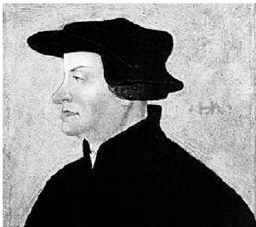
Ulrico Zwingli, ritratto di Hans Asper (Winterthur, Kunstmuseum)

ni centrali, iniziarono a predicare un ritorno ad un più austero cristianesimo evangelico libero da vincoli papali. Zurigo fu la culla della riforma in Svizzera, per opera di Ulrico Zwingli che predicava contro la rilassatezza dei costumi. "Basta con il lusso, basta con il servizio mercenario" diceva. Nel cantone Ticino la popolazione era molto legata alla religione tradizionale, ma anche qui non mancarono esempi di malcostume tra il clero. Famoso fu il parroco di Barbengo che si dedicava ai commerci ed ai piaceri della vita, usando la sua carica per fare il signorotto del paese. Gli svizzeri parteggiarono allora per l'una o l'altra parte; e cioè per la Lega Evangelica o per l'Alleanza Cristiana. Molti erano gli interessi comuni che univano e che al contempo dividevano i cantoni e la questione religiosa fu anche occasione per molti per cercare di estendere la propria influenza. Dalle dispute religiose che si tenevano davanti ai consigli cittadini e in cui gli esponenti delle due parti si affrontavano su diversi temi della fede, si arrivò in breve alla guerra di religione. Fu fatta pace e l'episodio fu ricordato come la "zuppa di Kappel". Ma inevitabilmente due anni più tardi si giunse nuovamente alla guerra e lo stesso Zwingli fu ucciso in battaglia. La seconda pace nazionale definì i confini di influenza tra la vecchia e la nuova fede.