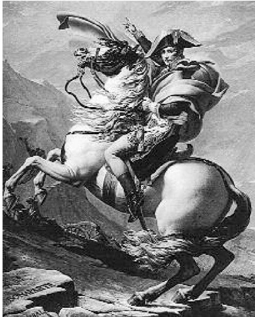
Iconografia di Napoleone Buonaparte a cavallo pronto a sferrare l'attacco

Gli eserciti della Repubblica Francese non cessavano di combattere contro le monarchie europee e ovunque vincevano guidati da giovani generali del genio. Tra essi spiccava la figura di Napoleone Bonaparte. La "convenzione" sancì il diritto dei francesi ad intervenire in tutti quegli stati in cui i popoli lottavano per la libertà o che disturbavano la sua politica egemonica. I territori della vecchia Confederazione erano vitali per gli interessi della Francia, perché le avrebbero permesso di incunearsi profondamente in Europa e di controllare il passaggio dei più importanti valichi alpini. Nel 1798 il paese fu invaso dal Giura e in pochi mesi venne proclamata la Repubblica Elvetica Unitaria, che durò fino al 1803. I cantoni furono soppressi, i baliaggi liberati e la Repubblica Elvetica risultò composta da 23 prefetture. Le monarchie europee nel 1799, alleate nella seconda coalizione, ripresero la guerra contro Napoleone. La "fortezza" delle alpi si trovò così ad essere assediata da tre lati dai corpi di spedizione diretti decoloro che erano contro le forze francesi. Il generale Suwaroff sceso dall'Austria, attraverso il Veneto e la Lombardia risalì le terre ticinesi per valicare il Gottardo dove si scontrò contro i francesi.