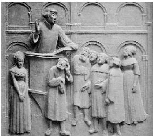
Bassorilievo di Zwingli nel portone di bronzo del duomo di Zurigo

La riforma religiosa in Europa fu essenzialmente un moto di rivolta contro la corruzione che imperava nelle gerarchie ecclesiastiche. Molti sacerdoti, soprattutto nelle regio-