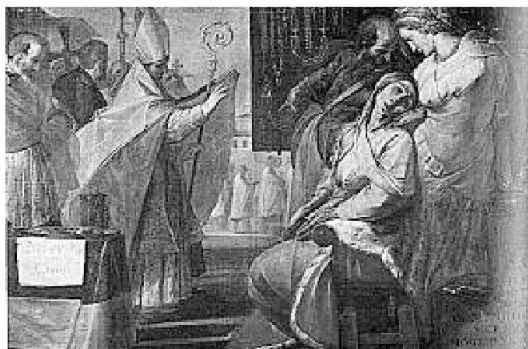
Miracolo di San Carlo Borromeo (Cerano, prima del 1610)