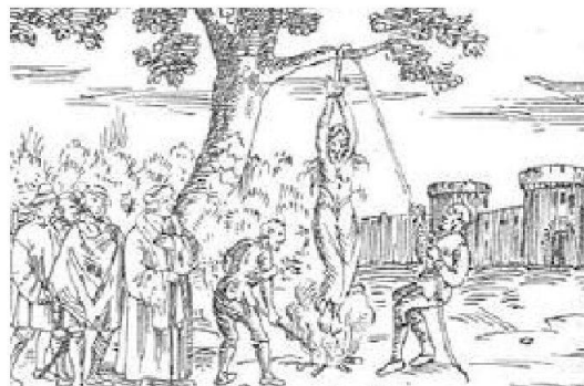
Rogo e supplizio di una presunta strega nel '600

Uno dei peggiori rischi che una donna poteva correre in Europa fino alla fine del '700, era di essere accusata di stregoneria. Anche le contrade ticinesi non furono immuni da questa superstizione, bastava un sospetto, un'accusa anonima per attribuire alle "streghe" una moria di bestiame, un cataclisma o la morte di un bambino in gravidanza. Nel 1580 nei pressi di Mezzovico e Sigirino sessanta donne furono accusate di stregoneria e sarebbero state arse vive se un buon prete non fosse stato capace di esorcizzarle tutte. In molti casi i giudici ricorrevano alle torture per far confessare alle sventurate le loro colpe. Capitava raramente di essere liberate dai giudici e ciò succedeva quando l'accusata resisteva a tutte le torture senza confessare, doveva allora pagare le spese del processo. Ma ovviamente erano più le confessioni spontanee.