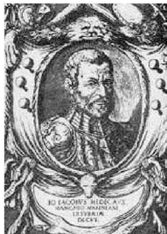
Ritratto di Gian Giacomo Medici detto "il Medeghino"

Nel periodo tra le due guerre di Kappel si inserisce l'episodio della guerra di Musso. Giangiacomo De Medici, condottiero e pirata sul lago di Como, protetto dagli Sforza di Milano, si era insediato nel castello di Musso, vicino a Dongo e da lì dominava l'alta Lombardia. Audace e astuto non aveva timore di compiere scorrerie ovunque i suoi