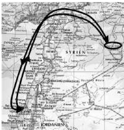
Le rotte del raid israeliano