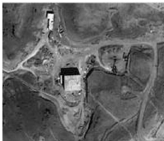
Dettaglio fotografico del 10.8.2007

Il confronto tra le immagini d'agosto con quelle d'ottobre indica evidenti cambiamenti. In quelle d'ottobre il grosso edificio quadrato non esiste più: dei bulldozer (uno di essi