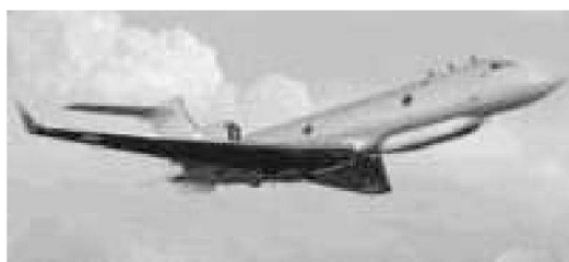
ELI - 3001