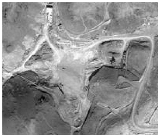
Lo stesso dettaglio al 24.10.2007