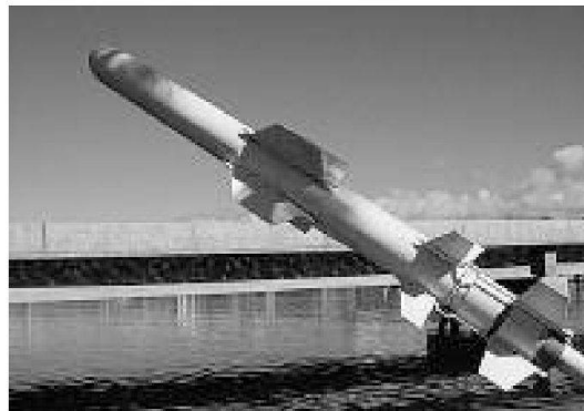
Il missile antinave HARPOON Block II

La fornitura di queste armi ha un valore complessivo di quasi $ 6.4 miliardi, il 98% del quale andrà a favore di un rafforzamento della difesa dello spazio aereo di Taiwan.