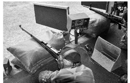
Un momento della prova del tiro sorpresa con il Fucile Schmid Rubin K31 e il Fucile assalto57 allo stand 300m.