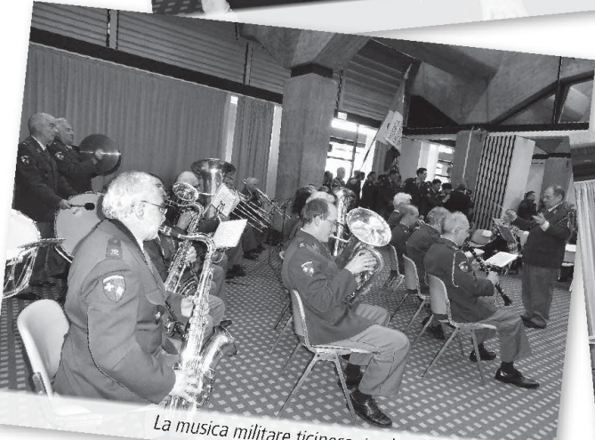
La musica militare ticinese, tradizione all'AGO STU