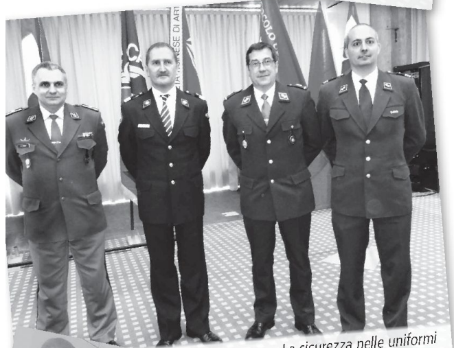
La sicurezza nelle uniformi