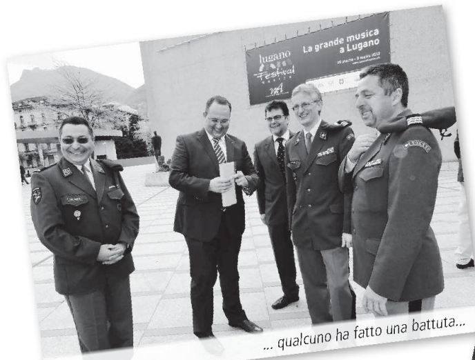
... qualcuno ha fatto una battuta...