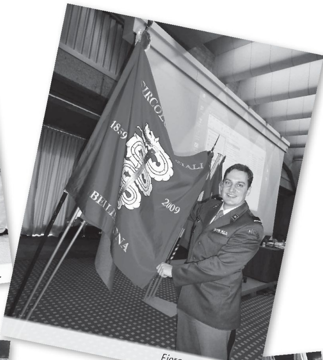
Fiero neo presidente