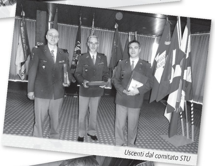
Uscenti dal comitato STU