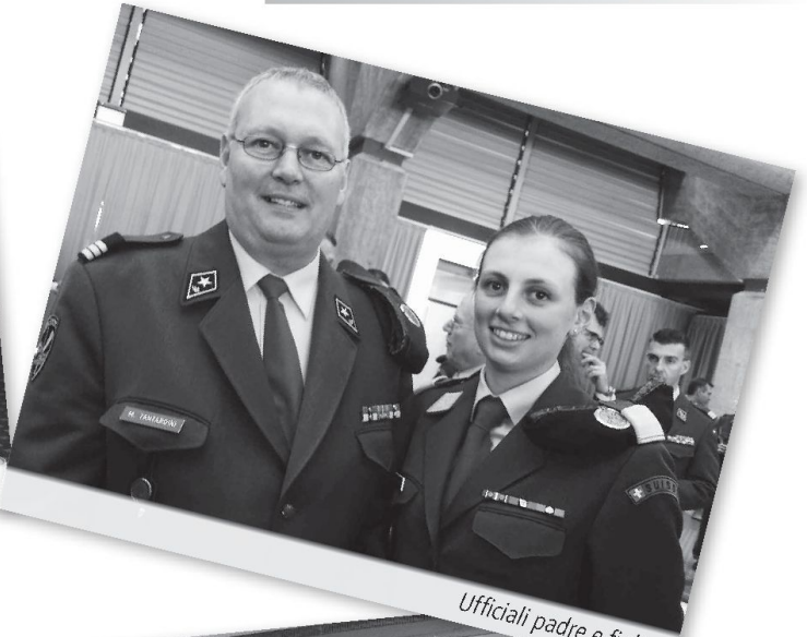
Ufficiali padre e figlia