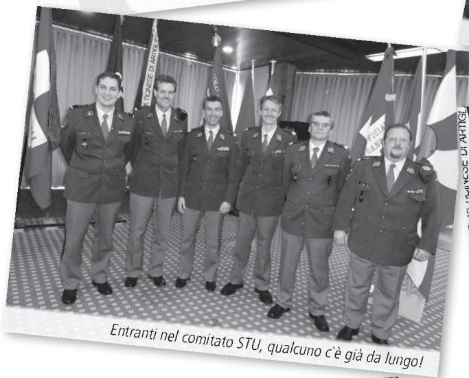
Entranti nel comitato STU, qualcuno c'è già da lungo!