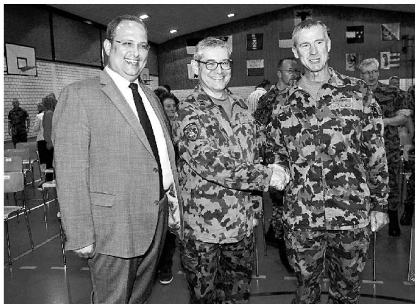
Congratulati dal Consigliere di Stato