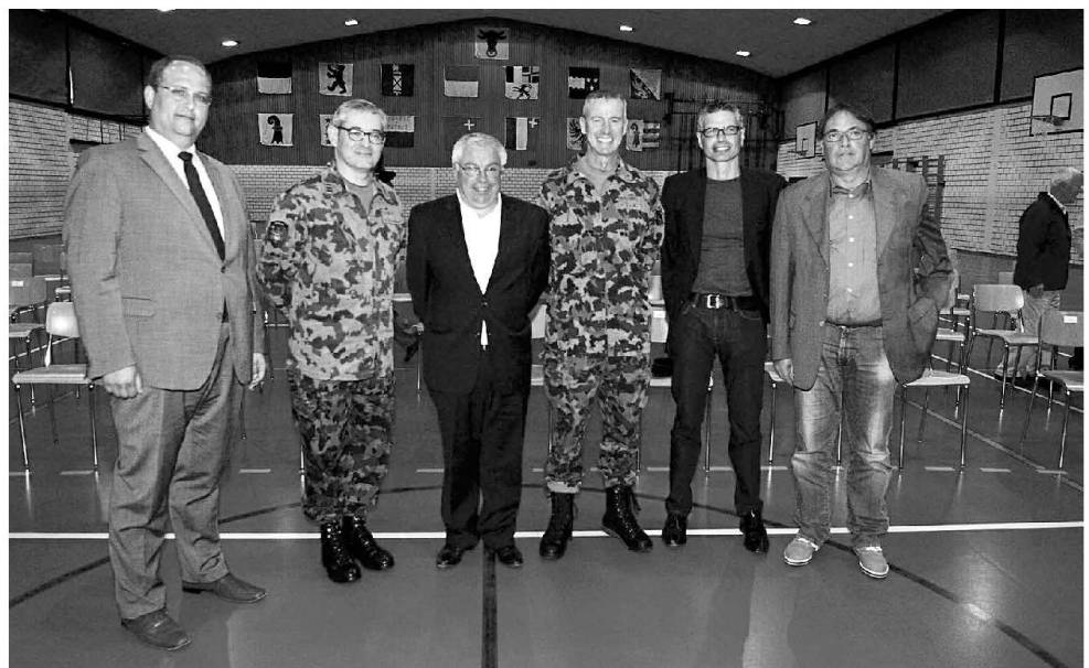
Appoggio assicurato dalle autorità cantonali e locali