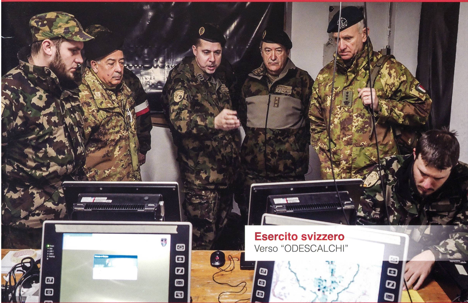
Esercito svizzero Verso "ODESCALCHI"