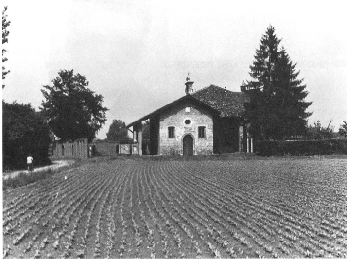
Santa Maria di Zivido al centro della battaglia