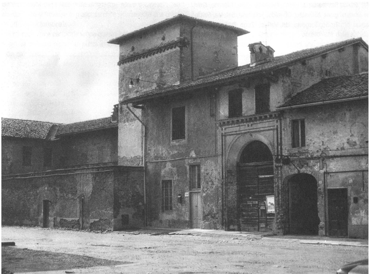
Castello di Zivido, qui morirono molti Svizzeri