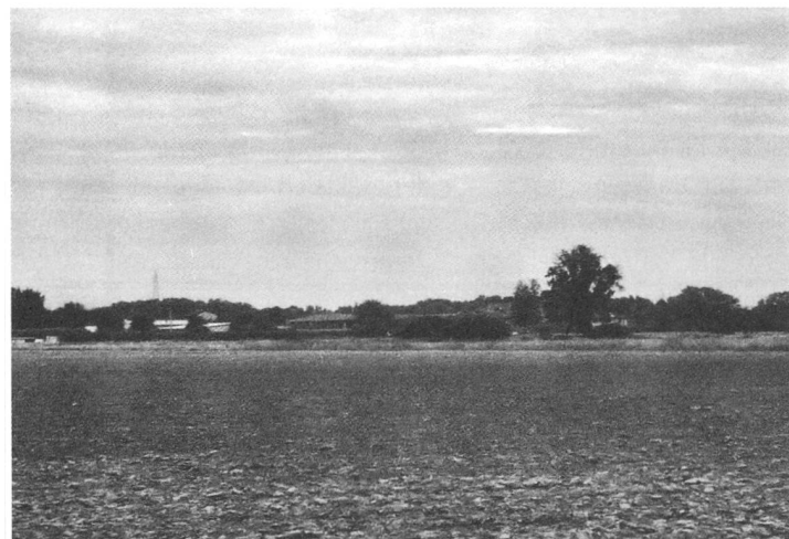
Uno scampolo del campo della battaglia, sullo sfondo la Cascina di Santa Brera

Per gli appassionati del tiro viene organizzato domani, 22 agosto, a Chiasso il "Tiro commemorativo della battaglia di Marignano".