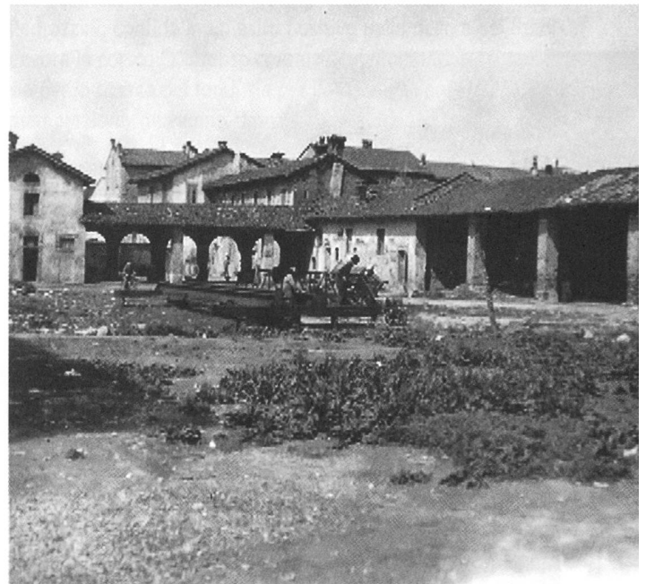
Cascina di Santa Brera, Francesco I trascorse qui la notte precedente la battaglia

La Fondazione Pro Marignano ha pure dovuto provvedere al restauro dell'Ossario dei caduti a Mezzano, fortemente danneggiato nel 2012 e a un'accurata manutenzione del monumento "Ex Clade Salus" a Zivido.