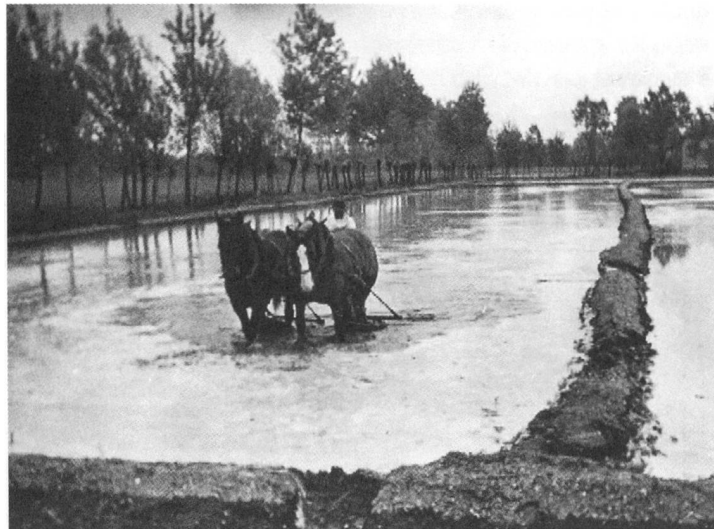
Così era il campo di battaglia il 2. giorno