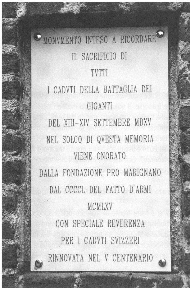
Il cippo a Santa Maria di Zivido