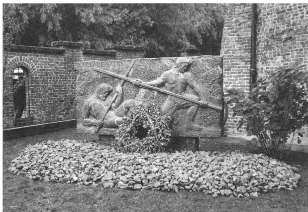
EX CLADE SALUS