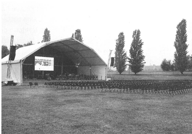
Tutto è pronto