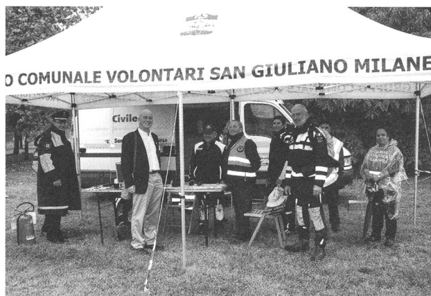
Il posto comando