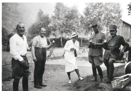
Momenti di svago