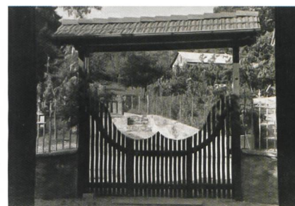
La vecchia entrata all'arsenale

crescimento della sensibilità del padronato verso le rivendicazioni della classe operaia. Nel trentennio che precedette la Grande Guerra, più di 200'000 Svizzeri scelsero la via dell'emigrazione, soprattutto provenienti dai Cantoni rurali: contadini, poi artigiani ed operai tentarono la fortuna oltre mare dando origine ad una potente diaspora svizzera negli Stati Uniti.