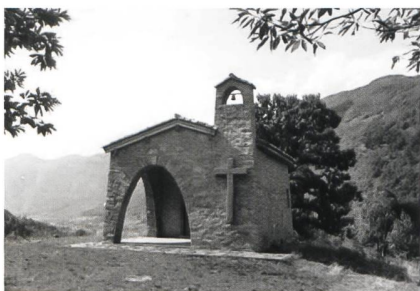
La chiesetta dei soldati, oggi dei ciclisti