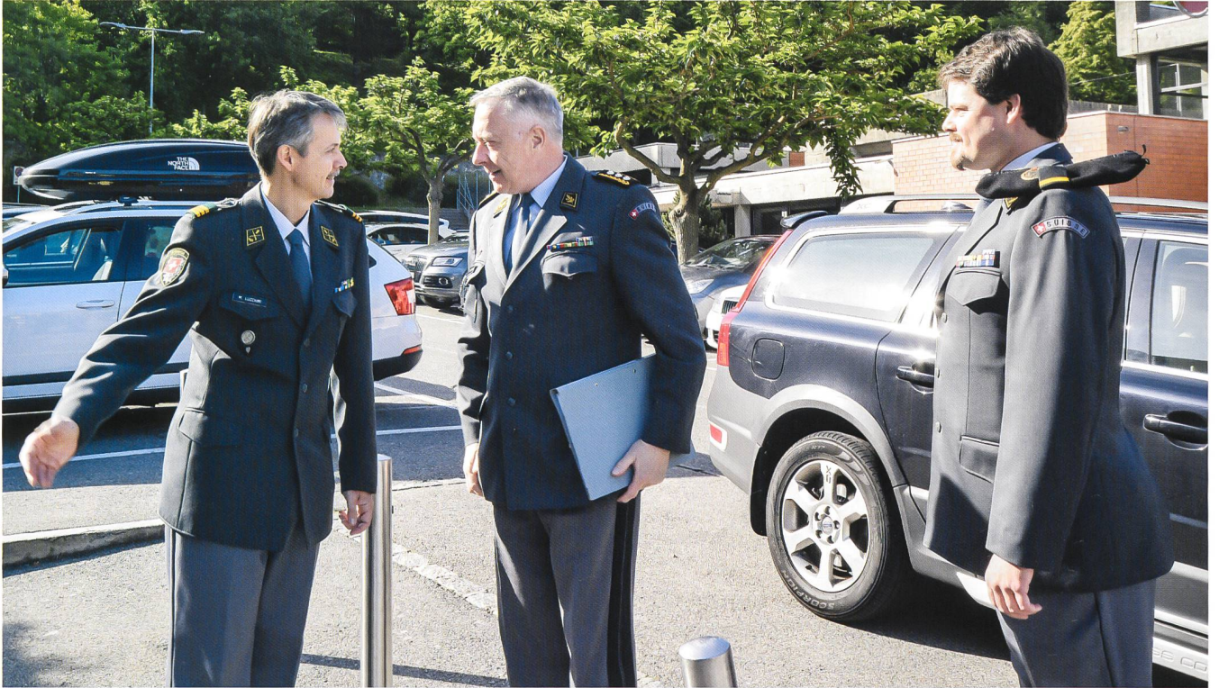
Benvenuto signor comandante di corpo