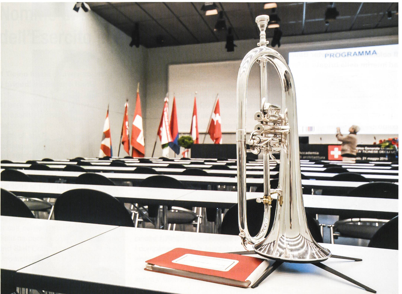
Tutto pronto, si può iniziare