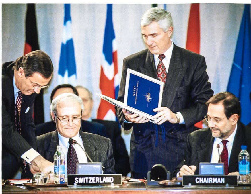
1996, firma del Presidente della Confederazione Flavio Cotti (@DDPS)