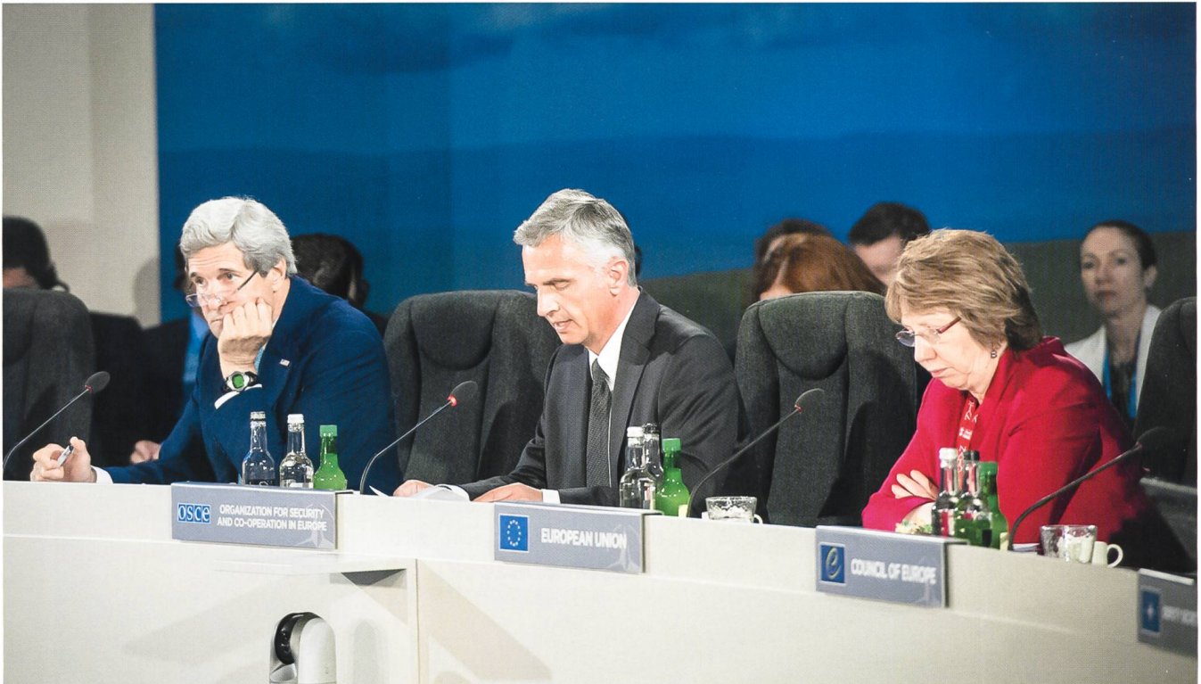
2014, il Presidente della Confederazione e Presidente OSCE Daniel Burkhard

decisione finale del Consiglio federale di partecipare al Partenariato per la Pace il 30 ottobre 1996. L'11 dicembre, praticamente alla fine del suo anno di presidenza dell'OSCE, Flavio Cotti, presidente della Confederazione, firmò il documento quadro del Partenariato. Da quel momento la Svizzera partecipa al Partenariato per la Pace (PpP).