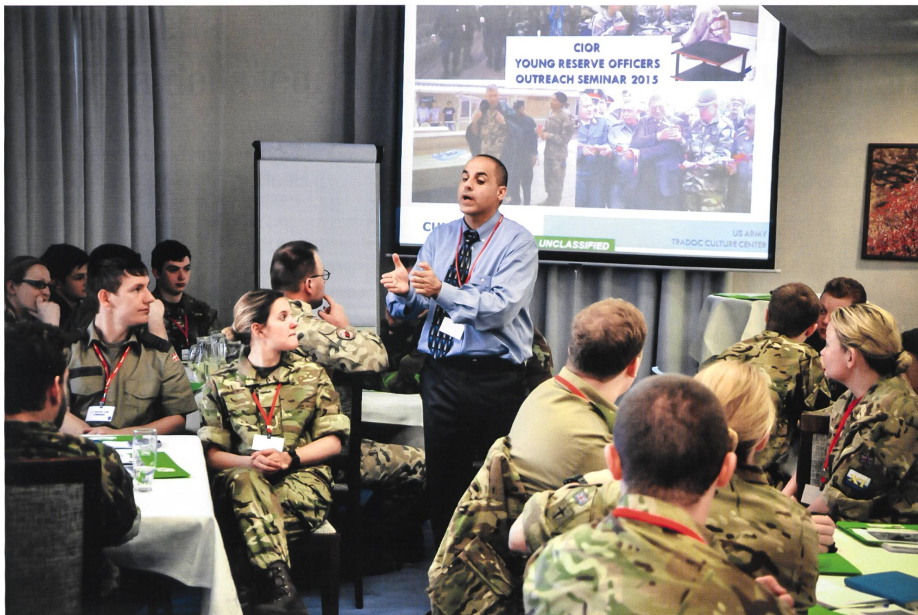
Seminario per ufficiali (@SSU)

dia abbiano un livello d'ambizioni che va oltre quello svizzero non va ignorato ma deve servire da stimolo per cercare basi comuni.