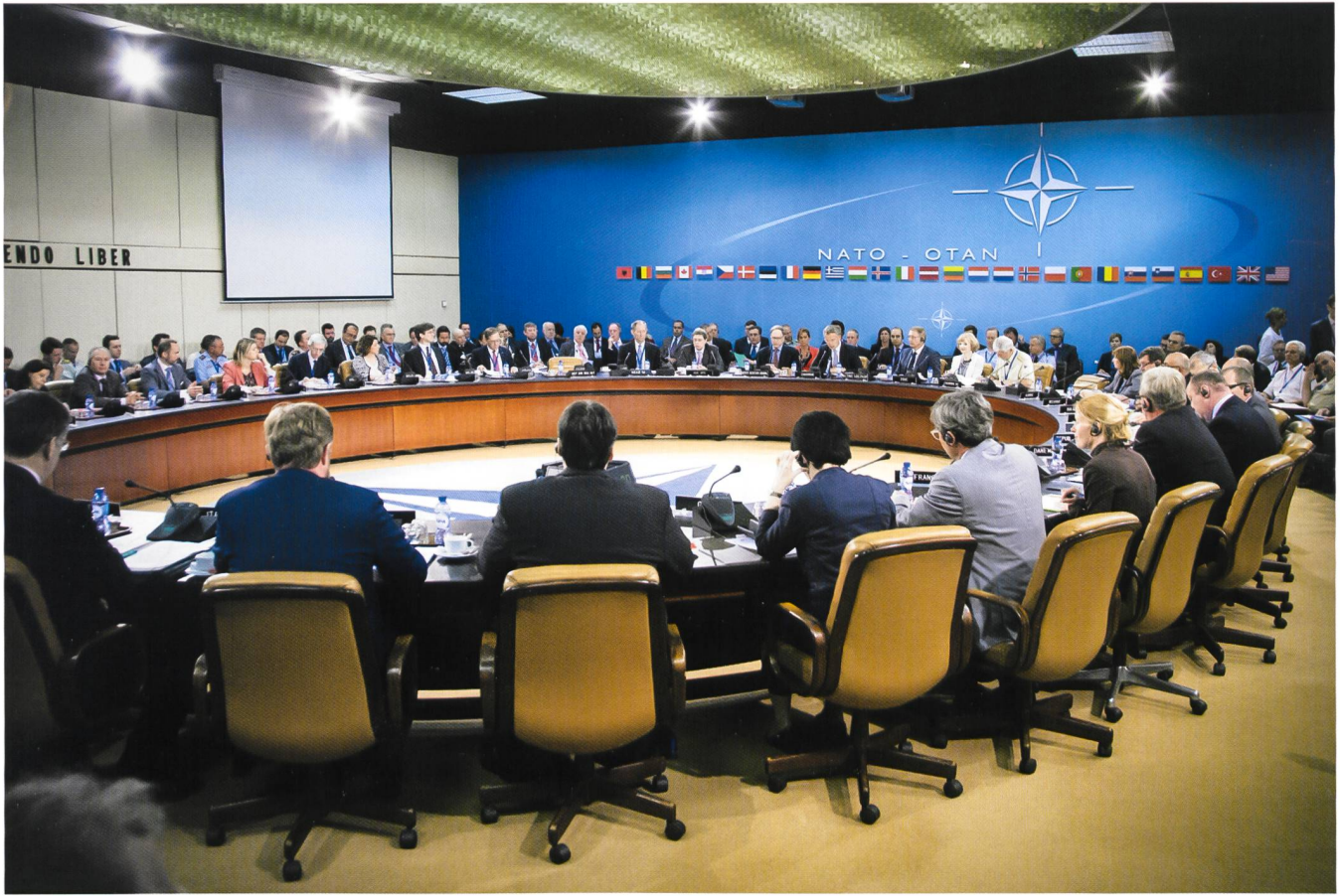
Riunione del Consiglio Atlantico del Nord

cooperativa e quindi il rafforzamento dei partenariati. Questa nuova dinamica è concretizzata nel pacchetto di riforme adottate a Berlino nel 2011: