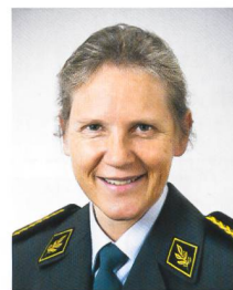
brigadiere Germaine Seewer

È risaputo che il personale è la risorsa più importante di un'organizzazione. Con l'avvio dell'USEs, il 1° gennaio 2018 l'esercito verrà trasferito in una nuova struttura di condotta. Gran parte degli stati maggiori e dei corpi di truppa viene ristrutturata, sciolta o costituita ex novo. Nel contempo, viene modificato il modello d'istruzione e di servizio e vengono introdotte nuove basi legali. Il trasferimento del personale di milizia rappresenta un progetto di ampia portata e un dossier d'importanza fondamentale nell'ambito dell'USEs.